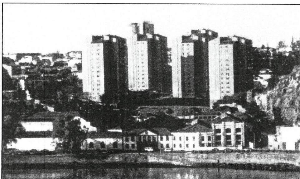
Figura 3 – Vista Geral do Bairro do Aleixo

Contrastando com a degradação das habitações e dos espaços que as circundam, é comum vermos automóveis de gama alta estacionados no Bairro, assim como inúmeras antenas parabólicas em diferentes andares das torres. Estes são alguns dos aspectos visíveis que nos permitem constatar que nem todas as famílias do bairro têm dificuldades económicas. Um técnico do PIBA (Projecto Integrado do Bairro do Aleixo) dizia-nos “ É fácil ver quando alguém entra no negócio da droga. Não conseguem disfarçar, começam logo a aparecer os sinais exteriores de riqueza, carro novo, muito ouro... ”