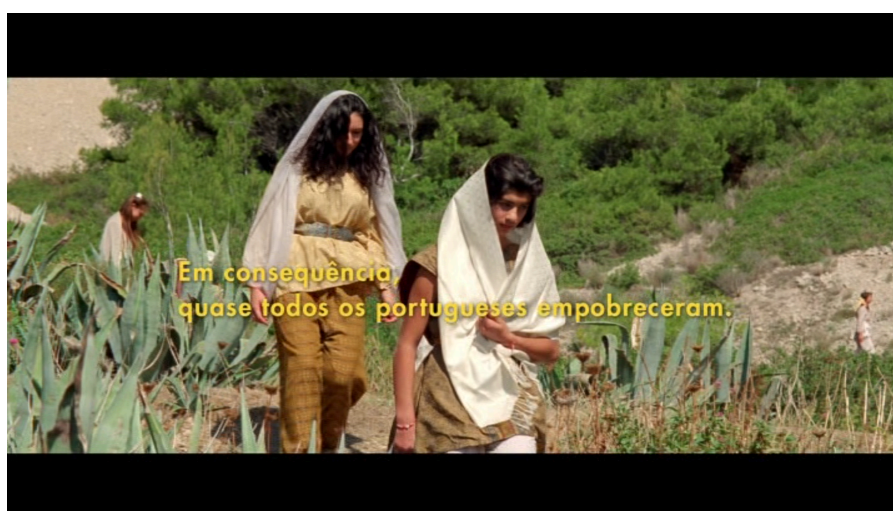
Fotogramas de As Mil e Uma Noites , de Miguel Gomes. Diz o texto: Durante este período, o país esteve refém de um programa de austeridade executado por um Governo aparentemente desprovido de sentido de justice social./Em consequência, quase todos os portugueses empobreceram.

O episódio com mais carácter político é o primeiro que Sherazade conta, no primeiro volume de As Mil e Uma Noites , e que representa uma reunião entre políticos, governo e a troika. Aí, Miguel Gomes estabelece uma relação entre o poder político e o poder sexual 59 . É um episódio asneirente, que recorre ao calão e a uma linguagem brejeira, em que a reunião, as pessoas que dela fazem parte, e os métodos e critérios de negociação— que posteriormente vão afectar directamente o país — saem