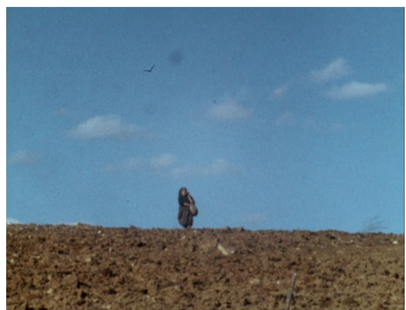
Fotogramas de Redemption . Imagens de arquivo. Em cima, as colónias. Em baixo: a ruralidade de Trás-os-Montes.