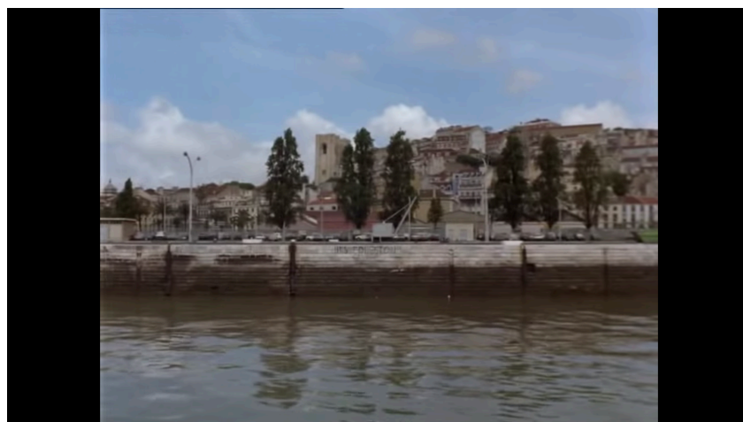
Em cima, o travelling aos estaleiros de Viana. Em baixo, um fotograma do travelling sobre Lisboa, em Recordações de Casa Amarela . Ambos são filmados a partir do rio.

Os trabalhadores do estaleiro enfrentavam vários casos de despedimento, e Gomes chega mesmo a filmar uma equipa da TVI a gravar um directo: para além do dispositivo cinematográfico, Gomes revela o televisivo, e o cinema perpetua aqui uma situação que, normalmente, é fugaz e momentânea 27 . Não o tema do directo — apesar de também o poder ser — mas o directo em si. Há aqui uma certa inversão de papéis na medida em que quem costuma reportar/noticiar/assinalar o cinema é a televisão. Acabado o directo, a equipa desmonta o equipamento. O plano corta e é impossível saber o que foi feito daqueles jornalistas. Sabemos, porém, que Gomes e a sua equipa ficou, como também sabemos que é graças ao cinema que se irá prolongar no tempo um retrato de um país