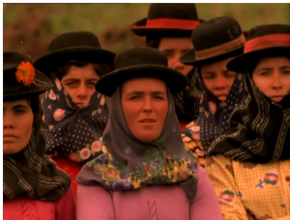
O momento em que Atena se dirige para as camponesas. O confronto é feito entre a postura teatral da actriz e o amadorismo das camponesas.

Para além disso, tanto César Monteiro como Miguel Gomes fazem contracenar não-actores com actores. Em Monteiro, isto constitui um dos muitos confrontos e dissonâncias que a sua obra