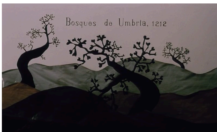
Em cima, fotograma de O Amor das Três Romãs , de João César Monteiro, sendo visível a preparação do cenário. Em baixo, fotograma de Cântico das Criaturas , de Miguel Gomes.

A escrita do argumento inicial de Aquele Querido Mês de Agosto demorou cerca de duas semanas, tendo sido posteriormente sujeito a alterações. O guião, que acaba por ter “um valor meramente utilitário”, serve essencialmente como base de trabalho (Gomes in Dias et Pereira, 2011). As alterações, aconteceram devido a um conjunto de imprevistos que acabaram por servir beneficemente o filme e o processo criativo do realizador 17 . Não havendo dinheiro para filmar o guião que estava escrito, uma pequena equipa de seis pessoas deslocou-se à região para filmar o ambiente e o