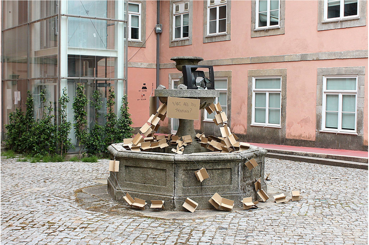
FIGURA 21 - CARD-(UN)BOX