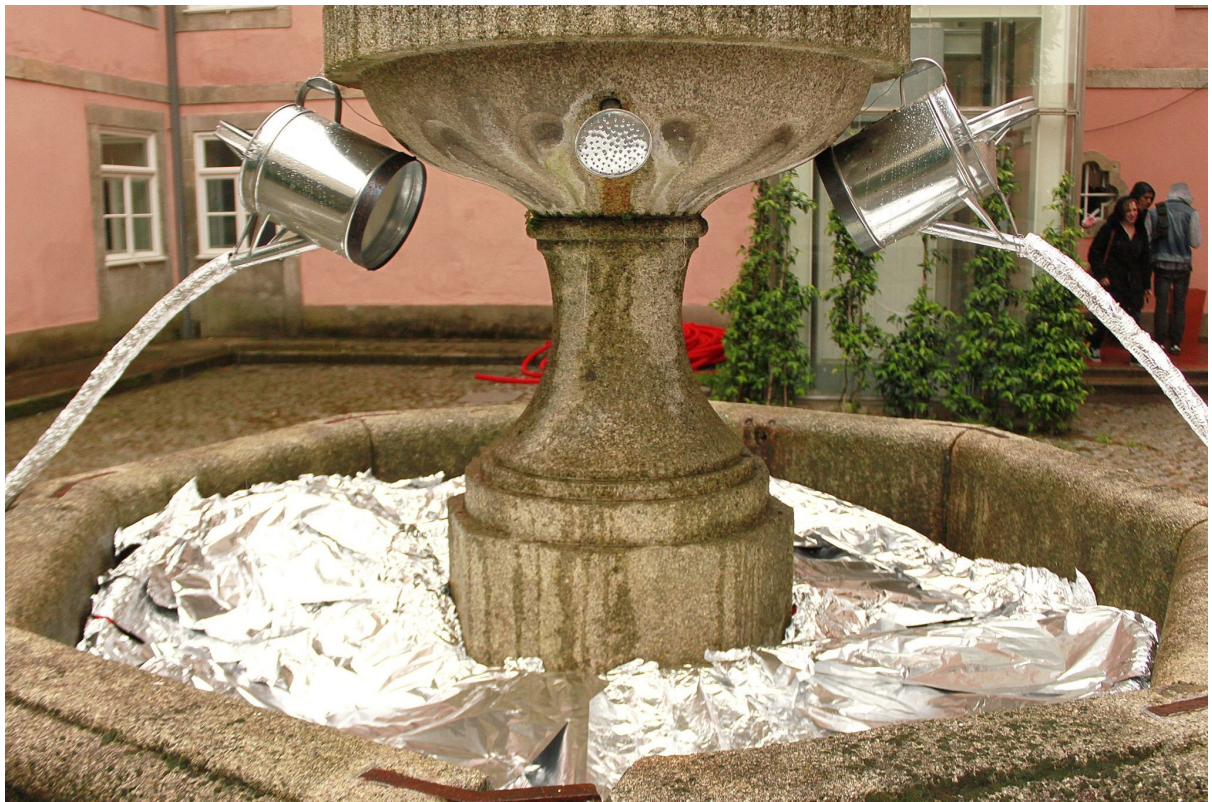
FIGURAS 16 E 17 - "BROKEN SET"