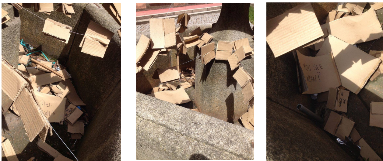
FIGURAS 18,19 E 20 - CARD-(UN)BOX ANTES DA DESINSTALAÇÃO

A segunda intervenção teve também em conta a previsão meteorológica para essa semana, sendo que essa semana seria uma semana sem chuva mas com bastante vento optou-se pela utilização de cartão e arame.