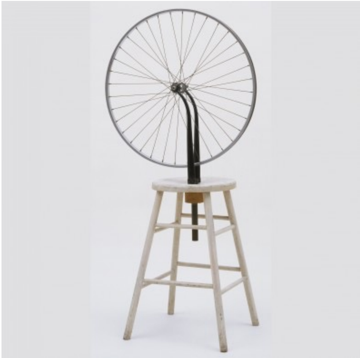
FIGURA 9 - “BYCICLE WHEEL”, MARCEL DUCHAMP

A primeira vez que o termo ready-made é usado é pelo artista francês Marcel Duchamp para descrever as peças que faz através de objectos já existentes. As primeiras peças de ready-