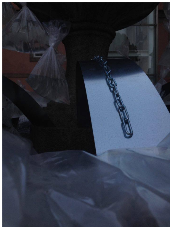
FIGURAS 25 E 26 - DIG[ANA] FOUNTAIN