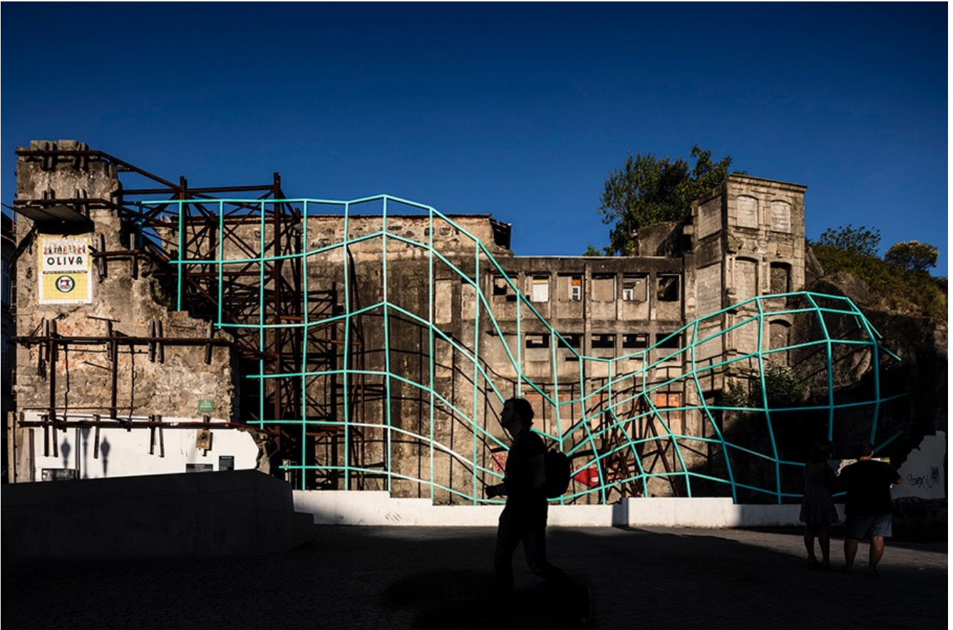
FIGURA 5 - "METAMORFOSE", FAHR