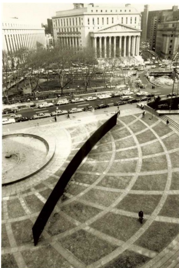
FIGURA 10 - "TILTED ARC", RICHARD SERRA

A prática de site-specific comunica a articulação e a troca que existe entre uma peça de arte e o sítio em que o seu significado é definido. De facto, esta torna-se a melhor definição e mais concreta daquilo que é a prática de site-specific. Se considerarmos