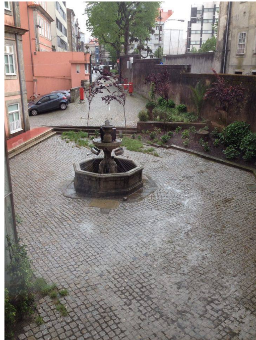
FIGURAS 14 E 15 - EVOLUÇÃO DA INTERVENÇÃO “BROKEN SET”

me”. O objectivo de interacção aqui é que o próprio espectador e a pessoa que por ali passa se sinta tentado a explorar e a compreender o significado destas frases.