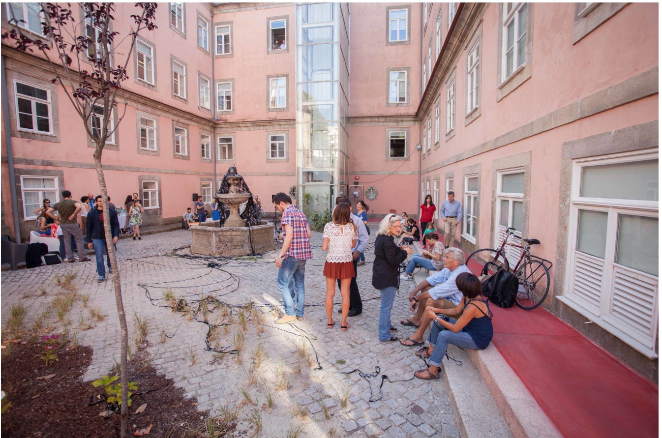
FIGURA 6 - "GREEN PINC", STILL URBAN DESIGN