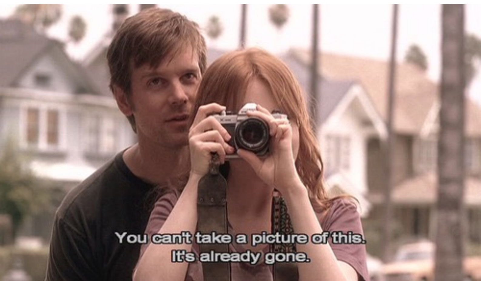
FIG.29 - STILL DA SÉRIE TELEVISIVA SIX FEET UNDER EPISÓDIO "EVERYONE'S WAITING"