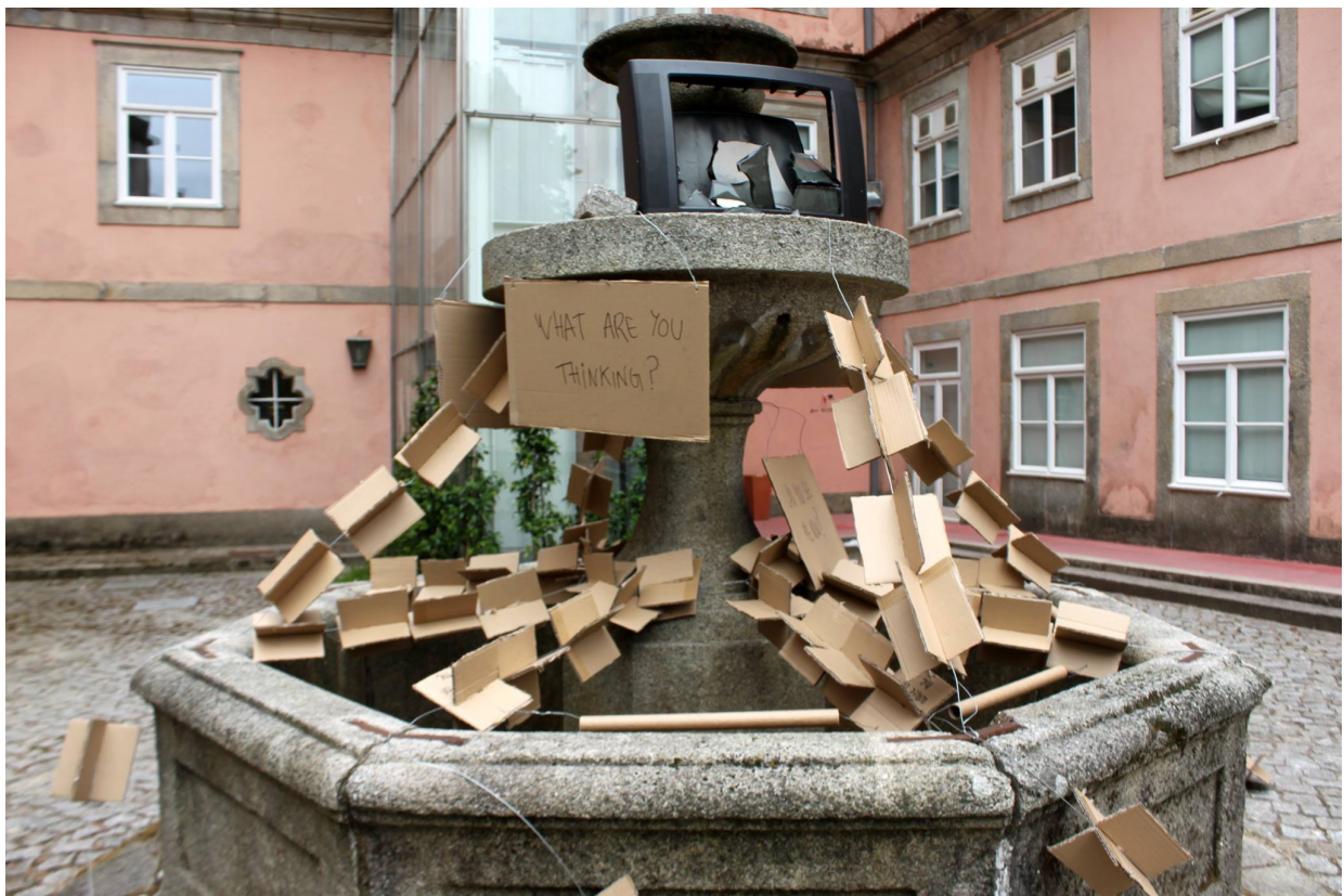
FIGURA 22 - CARD-(UN)BOX