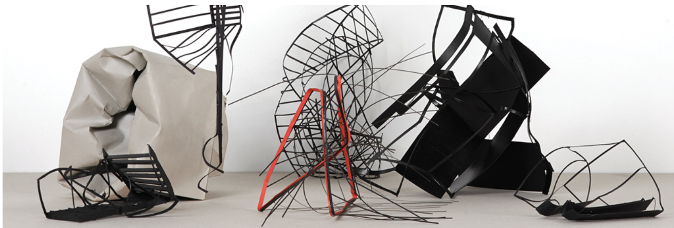
FIGURA 11 - “1:1”, MONIKA SOSNOWSKA

Muitas vezes, e como é o exemplo do “Tilted Arc” de Richard Serra ou o projecto “1:1” de Monika Sosnowska - projecto que consistia na consequência da reflexão da arquitectura pós-guerra na Europa Oriental - a prática site-specific não só explora os lados negativos do sítio como cria um problema dentro desse espaço.