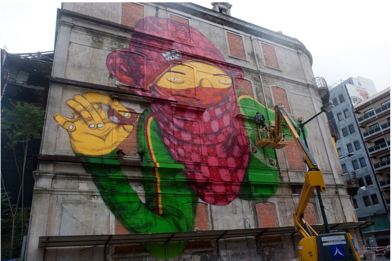
FIGURA 4 - MURAL DE BLU E OSGEMEOS, NO CRONO LISBOA

inverno, outono, primavera e verão. A escolha dos edifícios é desenvolvida segundo critérios de