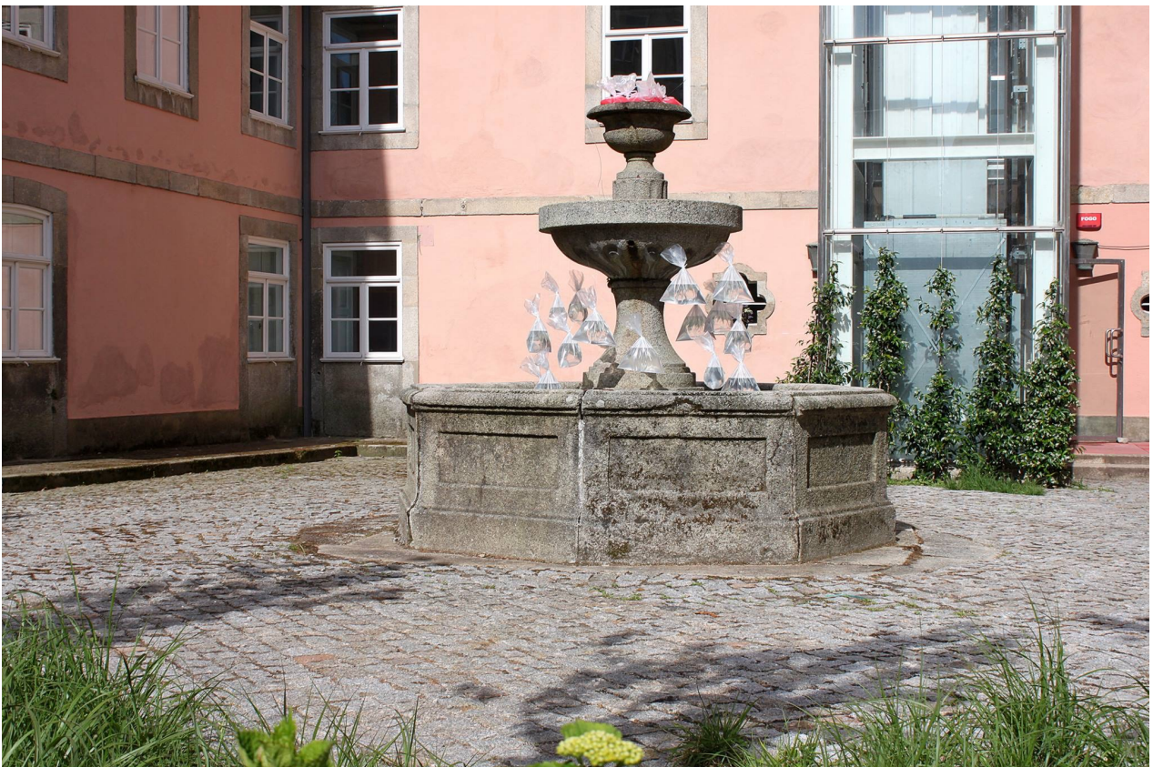
FIGURAS 23 E 24 - PLASTIC CHANDELIER