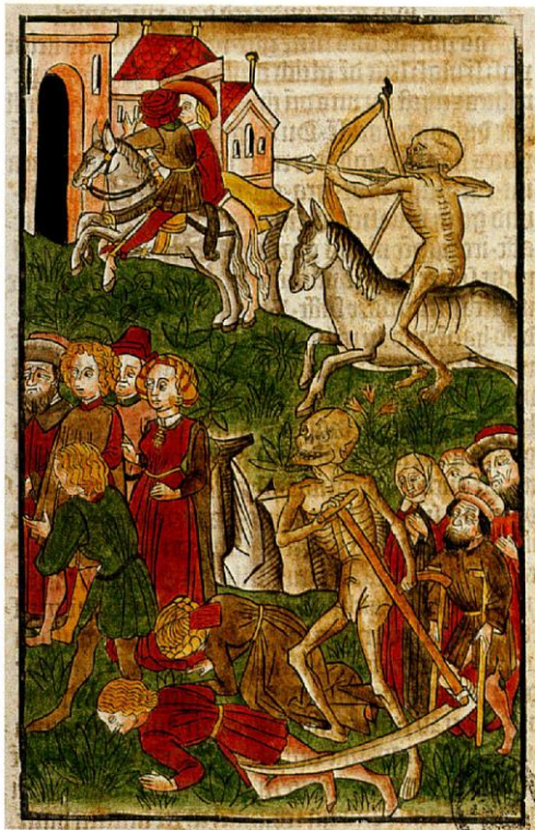
Holzschritte 2 und 3