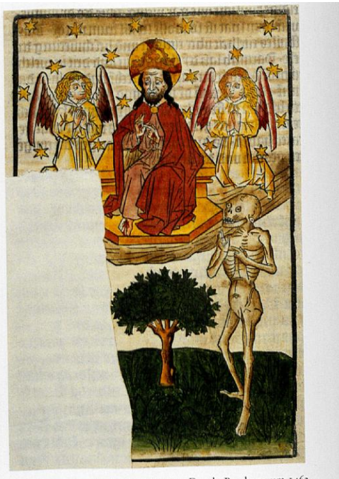
Holzschritte 4 und 5