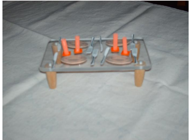
Foto 2 - Mesa com pratos, talheres e copos – História do Sumo Entornado