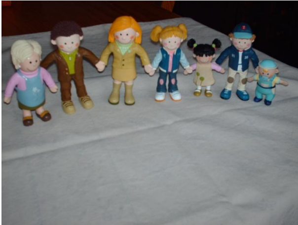
Foto 1 - Família