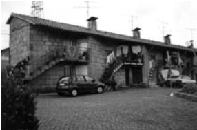
fig. 7 «Casas Renda Económica» Barcelos. Nuno Teotónio Pereira.