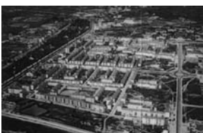
fig. 1 e 2 «Casas Renda Económica» Bairro de Alvalade, Lisboa.

Depois de um arranque fundamentalmente pragmático, com as células 1 e 2 do bairro de Alvalade [fig. 1 e 2], é ao longo das décadas de 50 e 60, que as HE estruturam, organizam e aplicam estratégias de resposta à questão da habitação em contextos urbanos e rurais, numa constante aposta de um habitar moderno, incentivando e aplicando conceitos formais associados à introdução de unidades de vizinhança.