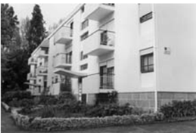
fig. 5 Ramalde, Porto. Fernando Távora.

Podemos, a título exemplificativo, referenciar obras que, quer pela linguagem adoptada, quer pelos princípios urbanos, quer pela exploração dos dispositivos domésticos, entre outros, mas principalmente, pela relação destes com as condições económicas vigentes, se destacam de um vasto conjunto de propostas.