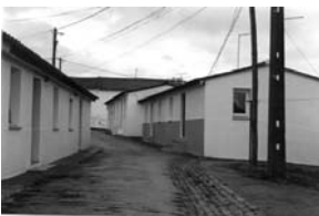
fig. 9 Stº Estêvão. Vítor Figueiredo.

Apontamos, a título exemplificativo, obras de Vítor Figueiredo, de Arnaldo Araújo e de Bartolomeu da Costa Cabral com Vasco Croft, como sejam, Stº Estêvão, Moura Morta e Chamusca, respectivamente.