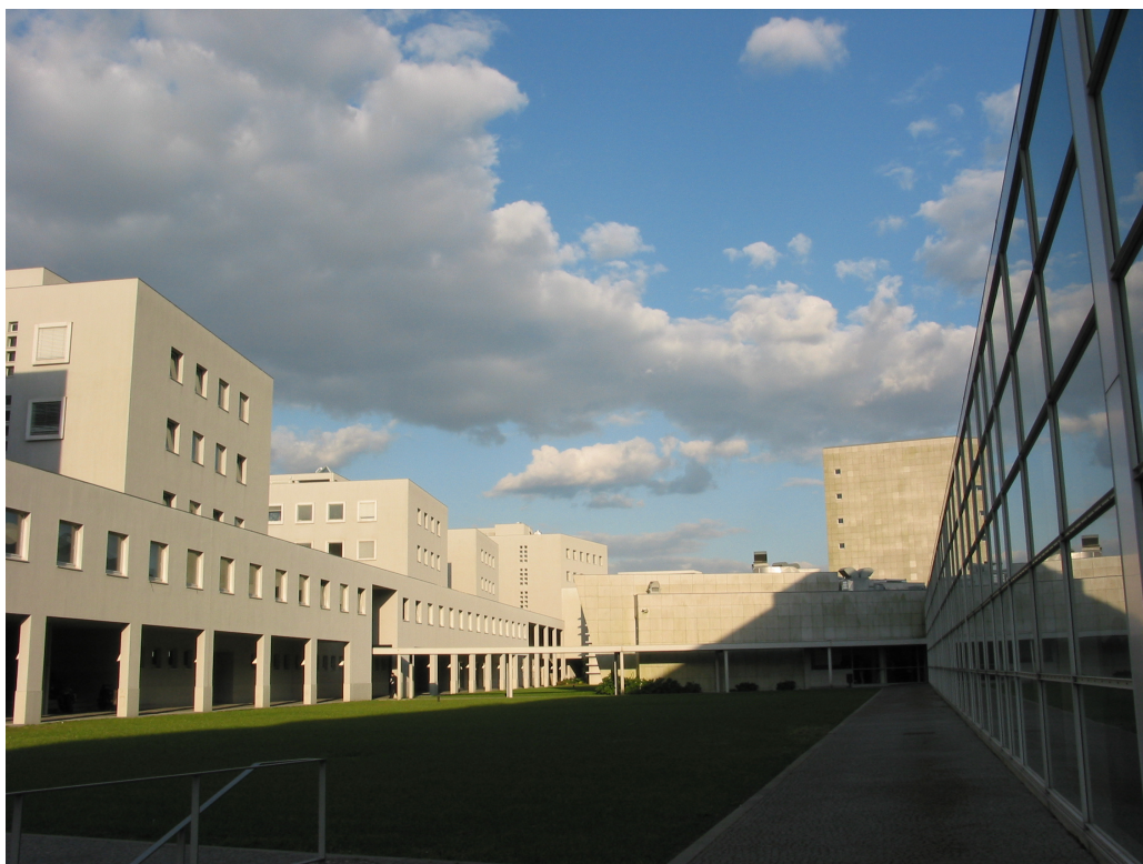
Figura 1 – Faculdade de Engenharia da Universidade do Porto, 2009.

A ditadura surgida do movimento militar de 1926 marcou um período de fortes limitações à expansão da Universidade do Porto. Contudo, é nesse mesmo ano que se operam importantes transformações no ensino da Engenharia, uniformizando o seu ensino nos diversos estabelecimentos nacionais. Nesse ano, a denominação da Faculdade Técnica é alterada para Faculdade de Engenharia, designação que se mantém nos dias de hoje. No ano do centenário da Academia Politécnica (1937), é inaugurado o edifício da Faculdade na Rua dos Bragas, no qual os cursos de Engenharia são ministrados até ao limiar do novo século. A partir de 2000, a FEUP conta com novas instalações no pólo II da Universidade do Porto. A Figura 1, a seguir, a apresenta uma imagem atual do prédio da Faculdade de Engenharia da Universidade do Porto.