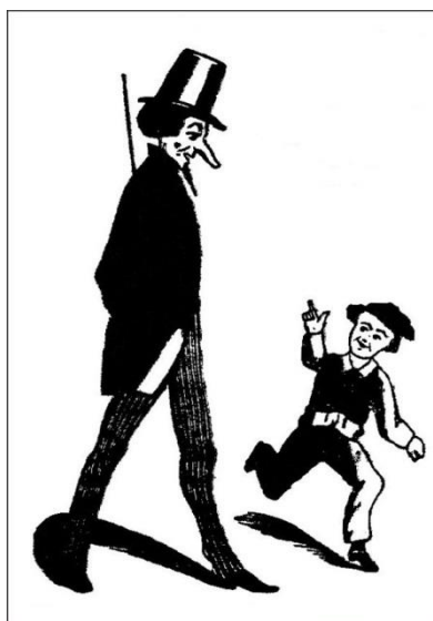
Ilustração que acompanhava o texto no Novo almanach de lembranças

O meu amigo Boaventura Jeremias Pascoal, é um desses entes infelizes a quem a natureza parece haver formado a capricho, tornando-os renegados das belezas primitivas da mãe Eva.