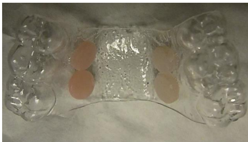
Figura 1 Dispositivo intraoral com as amostras de resina a testar: polimetilmetacrilato (esquerda) e poliamida (direita).

BEGO, Bremen, Alemanha) e uma pasta de polimento (244-AZUL Universal High Shine, KENDA, Vaduz, Principado de Liechtenstein) numa máquina de polimento LEM (KaVo, Biberach, Alemanha). Um procedimento semelhante foi utilizado para as amostras de Poliamida Deflex ®, excetuando o uso da lixa no polimento. Procedeu-se à desinfecção das amostras, por imersão em etanol 70% seguido de sonicação durante 15 minutos, sendo posteriormente lavadas duas vezes com água destilada estéril. (21) Duas amostras de cada material foram coladas na superfície palatal de cada dispositivo intraoral (Figura 1). Antes da sua exposição à cavidade oral, os dispositivos intraorais e as amostras foram armazenados em ambiente asséptico.