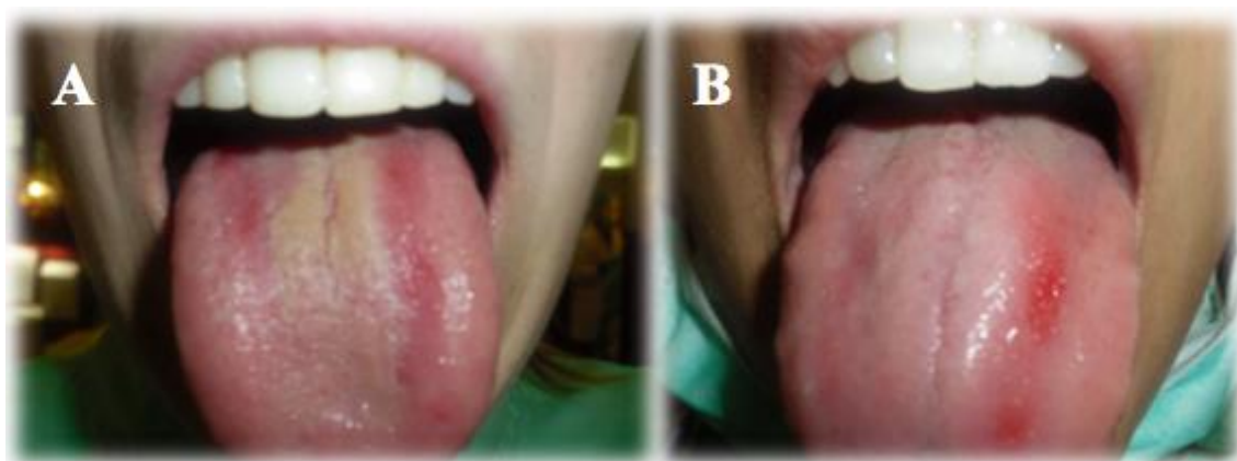
Figura 2 Aspetto macroscópico do dorso da língua após o contacto de 4 horas com as resinas polimetilmetacrilato e poliamida. (A) Reação a ambas as resinas testadas, mas com maior intensidade à resina de poliamida e (B) reação à resina de poliamida.

A idade média dos participantes foi de 23,00 \pm 0,24 anos. O valor de Knutson atribuído a cada participante foi 0, ou seja, após o exame intraoral verificou-se a ausência de cáries visíveis. Nenhum dos participantes era fumador e todos apresentavam um elevado padrão de higiene oral. O protocolo da atividade experimental foi cumprido por todos os participantes. Dois dos participantes desenvolveram uma reação tipo alérgica à resina flexível de PA testada, sendo que um destes também apresentou uma resposta tipo alérgica, com menor intensidade, à resina rígida testada (PMMA) (Fig.2). Os participantes aperceberam-se desta reação apenas no final do período experimental.