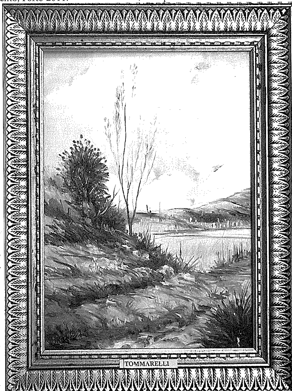
F. Tommarelli, Paesaggio , 1976.

Villasante T., Redes e alternativas. Estratégias e estilos criativos na complexidade social , Editora Vozes, Petrópolis 2002.