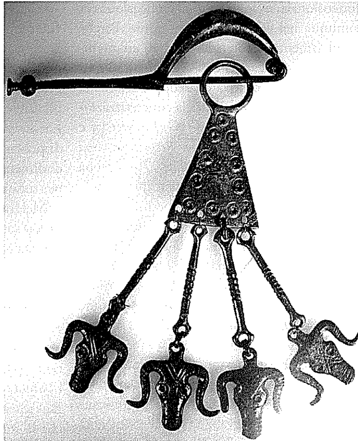
Fibula con pendenti di area Veneta (VI sec. a.C.)

C'è da stare in allerta per il fatto che l'incremento di situazioni di interazione, di convivialità, di iperconnessione e di coproduzione, per se stesso, non è stato sinonimo di universalità e di diffusione di valori con sentimento comune.