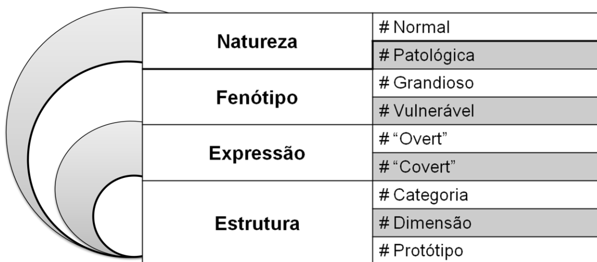
Fig.1 Inconsistências fenotípicas e taxonómicas na conceptualização do narcisismo (adaptado de [18])

Foram identificados quatro aspectos da descrição fenomenológica e taxonómica que são inconsistentemente abordados na literatura do narcisismo patológico e PPN, levando a uma base teórica e empírica pobremente coordenada. Estas inconsistências envolviam diversidade nas conceituações da natureza do narcisismo (Normal, Patológica), fenótipo (Grandioso, Vulnerável), expressão (Overt, Cover), e estrutura (Categoria, Dimensão, Protótipo). (20) (Ver figura 1)