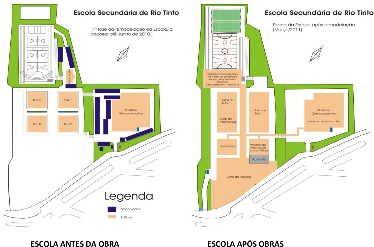
FIGURA 2 – Plantas da Escola

Para as aulas de Educação Física, a escola possui sete espaços, sendo três dentro do Pavilhão Gimnodesportivo – G1, G2 e G3 –, dois no Ginásio - G4 e G5 – e dois exteriores – G6 e G7. Todos estes espaços estão previamente destinados para os Professores no quadro de rotação. No entanto, em condições climatéricas menos favoráveis, quem está a lecionar no G7 e no G6 desloca-se para o G2 e G4, respetivamente. Relativamente aos balneários, as turmas que têm aulas no espaço G6 e G4 equipam-se no Ginásio. Para os restantes espaços equipam-se no Pavilhão Gimnodesportivo. O Pavilhão Gimnodesportivo e o Ginásio (G4) têm marcações de campos de futebol, andebol, badmínton, basquetebol e voleibol com duas balizas e tabelas de