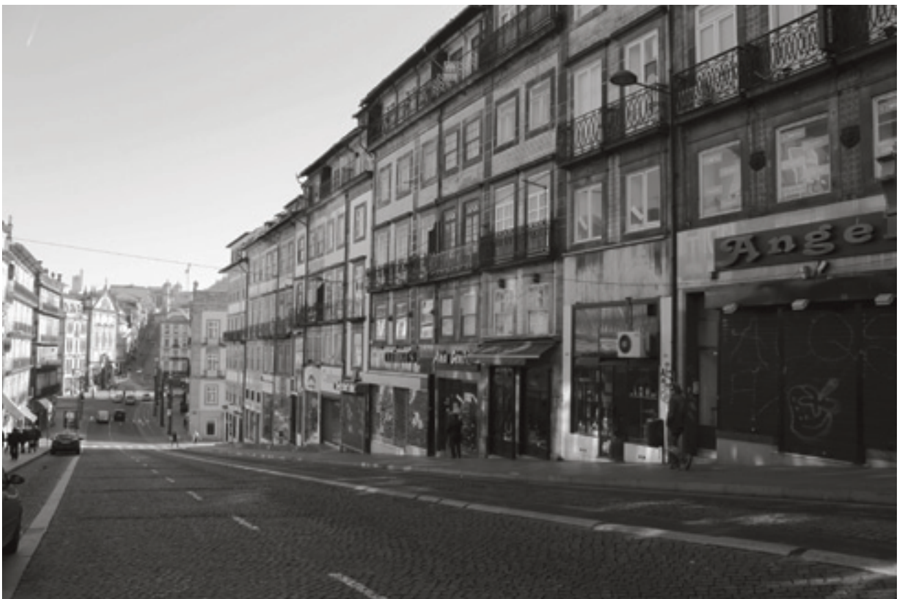
Fig. 6 – Rua dos Clérigos, no Porto (vista actual)

Na habitação unifamiliar burguesa construída na cidade do Porto entre o séc. XVII e XIX, é um facto a existência de estruturas elementares que vão persistindo, desde o séc. XVI, mas em permanente evolução/variabilidade. Trata-se de uma repetição ordenada de elementos, dentro de uma infinita variedade formal (janela, porta,