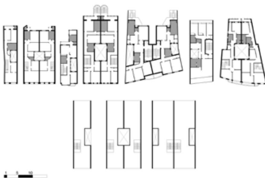
Fig. 5 – Modelos a partir do “tipo estreito e profundo”, com saguão e escada paralela à parede de meação. Duplicação; simetria; deformação; adaptação às particularidades do lote e procura de edificabilidade máxima. Da esquerda para a direita, esquemas produzidos a partir das Licenças de Obras 1930-0328; 1929-0644; 1944-0281; 1938-1052; 1936-1471; 1954-0094; 1938-0076 (Arquivo Histórico da Câmara Municipal do Porto), (desenhos da autora)