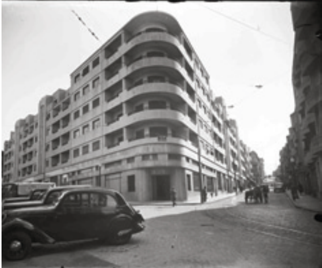
Fig. 9 – Domingos Alvão, Porto, Vista geral de um edifício na Rua de Sá da Bandeira e Rua Firmeza, [19--], PT/CPF/ALV004591, Centro Português de Fotografia/DGARQ/MC; (finais dos anos 40, inícios de 50?)