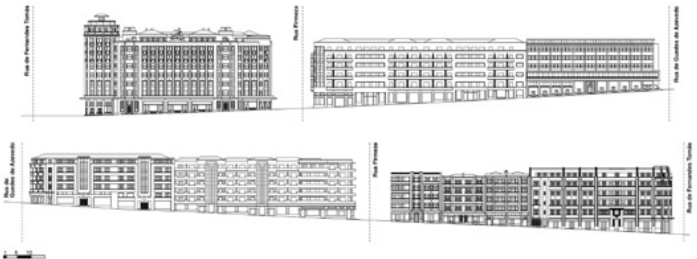
Fig. 11 – Quarteirões superiores da Rua de Sá da Bandeira, no Porto. Alçado Nascente e Poente. Edifícios de habitação plurifamiliar projectados entre meados dos anos 30 e finais dos anos 40 (desenhos da autora)

do lote gótico-mercantil, que decompõem a fachada em unidades claramente individualizadas.