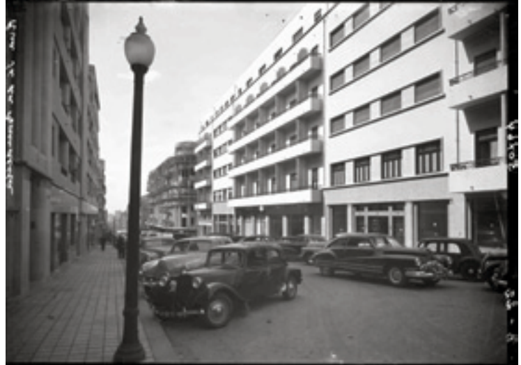
Fig. 10 – Domingos Alvão, Porto, Rua de Sá da Bandeira, [19--], PT/CPF/ALV005460, Centro Português de Fotografia/DGARQ/MC; (finais dos anos 40, inícios de 50?)