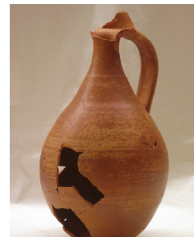
Fig.17 –Jarro de bocal trilobado

Os dados relativos a este objecto inicialmente resumiam-se aos existentes na ficha de inventário do MNSR (Anexo C, N°10). Sabe-se que se trata de uma peça proveniente de Paços de Ferreira e que foi sujeita a um restauro em 2007 no Museu D. Diogo de Sousa.