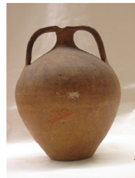
Fig.20 – Bilha

Este é outro dos objectos oriundos possivelmente de Paços de Ferreira, o único elemento que possuíamos no início da investigação era o Nº30 escrito a lápis magenta no bojo da bilha. Consultando o Inventário do MMP de 1938/40 (Anexo C, Nº3), verificamos que o Nº30 diz respeito ao conjunto de vasos da Agra de S. Brás, Frazão, Paços de Ferreira, ao qual foi atribuído o Nº28-31. Desta forma assumimos que pertencia a este lote de objectos arqueológicos.