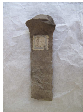
Fig.6 –Faca de sílex

A informação existente à cerca deste objecto encontra-se na Ficha de Inventário do MNSR (ver Anexo C, N°10), e como se pode constatar apenas há uma breve descrição da lâmina, e a indicação da proveniência deste objecto, Necrópole de Sales, freguesia de Tourém, concelho de Portalegre. Através deste dado, foi realizada uma pesquisa na base de dados do IGESPAR, onde se conseguiu apurar que esta necrópole se localiza em Montalegre e não Portalegre. Os elementos disponíveis na base de dados dão conta da existência de vários conjuntos de