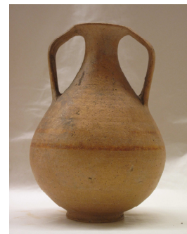
Fig.16 – Ampulla de duas asas simétricas