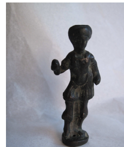
Fig.22 – Estatueta em bronze

Relativamente a esta estatueta em bronze, surgem dúvidas que não foi possível esclarecer em concreto, visto que além de não existir qualquer informação sobre o seu modo de incorporação, proveniência e contexto arqueológico, possui uma etiqueta na base com a designação “ CMP 14/ Lapidar”, remetendo para o facto de se tratar de um objecto do MMP. Porém analisando o Inventário realizado pelo MMP em 1938/40 o N°14 da secção de Lapidar não corresponde a esta peça nem a nenhum dos items das outras secções. Na secção de objectos arqueológicos (ver Anexo C, N°3) o N° 14 é referente à estatueta de barro celtibera, o que pode levantar a hipótese de ter havido um lapso na etiquetagem.