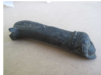
Fig.23 – Cabo de Pátera