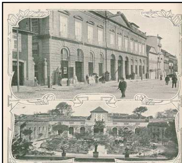
Fig.3 - O paço e jardins das Carrancas, residência d'El-Rei na capital do norte – In « Ilustração Portuguesa », nº143, 16 de Novembro de 1908

Com a excepção destas as visitas, o palácio encontrava-se praticamente vazio, e no testamento datado de 1915, que viria a ser reconhecido apenas após a sua morte, em 1932, D. Manuel II determina a entrega do Palácio à Misericórdia, para que nele se instalasse um hospital 47 .