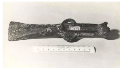
Fig.27 – Machado de talão

Estamos perante um machado de talão em bronze, pertencente ao MNSR (ver Anexo C, N°10), e que se encontra referenciado na obra “Machados e outros objectos de bronze”, editado pelo MNSR em 1946, sabendo-se por aqui que é proveniente de Vilar de Mouros em Caminha e foi oferta de Vasco Valente e terá sido incorporado antes de 1946. Da consulta realizada no arquivo do MNSR não foi possível obter elementos sobre a data de incorporação, mas tudo aponta que tenha sido entre 1940 e 1946. O estudo desenvolvido permitiu fazer uma descrição mais rigorosa deste tipo de artefacto arqueológico, e estabelecer paralelos tipológicos com outros objectos já estudados, tendo sido consultada bibliografia especializada para este fim.