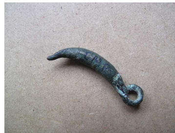
Fig.26 – Corpo de fíbula

Relativamente a este corpo de fíbula, trata-se de um objecto pertencente ao MMP (ver Anexo C, Nº10) que se encontra referenciado na obra “Machados e outros objectos de bronze”, editado pelo MNSR em 1946, que o aponta como sendo o Nº 12 do Guia do Museu Municipal do Porto, de 1902 (ver Anexo C, Nº12).