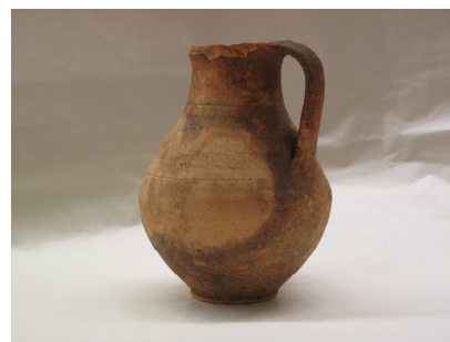
Fig.14 – Púcaro/Cântara

Relativamente a este objecto foi possível com base em analogias com outros objectos definir a sua tipologia, fazer a sua descrição física em termos morfológicos e de pasta, e ainda obter dados importantes sobre o seu contexto arqueológico e da existência de um número significativo de objectos provenientes do mesmo sítio arqueológico que este. Nas investigações realizadas foi possível verificar que no Museu de História Natural da Universidade do Porto se encontram depositados cerca de 96 objectos da Necrópole de Valadares e que terão sido oferecidos pela mesma pessoa que referida no papel que acompanha esta peça, que segundo se pode apurar junto de pessoas que conheciam os donos da habitação onde a necrópole se situa, seria o antigo proprietário presentemente já falecido.