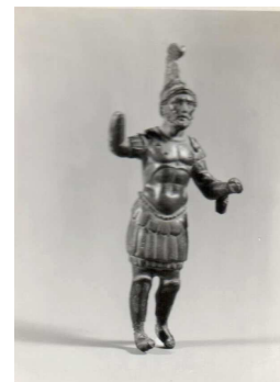
Fig.21– Estatueta de Marte

Para o objecto em questão a ficha de inventário do MNSR (Anexo C, Nº10) fornece alguns dados importantes, nomeadamente informação do ano em que foi adquirida e incorporada no MNSR, e também sobre o sítio arqueológico de que provém. Sabemos portanto que não se trata de uma peça herdada do MMP à semelhança de outras estudadas, mas sim uma peça incorporada directamente no MNSR.