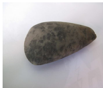
Fig.12 – enxó silimanite

Trata-se de mais um objecto cuja proveniência, incorporação e contexto arqueológico não se conhece. Das pesquisas realizadas não se encontraram dados relativos a este objecto, podemos apenas defini-lo como uma enxó de silimanite, que vulgarmente surge em contextos datados do neolítico/calcolítico e que pelo caso que temos, poderia mesmo tratar-se de um objecto votivo, dado que não possui praticamente marcas de utilização. A sua reduzida dimensão também nos leva a crer que se tratava de um instrumento destinado a tarefas mais minuciosas.