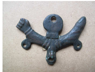
Fig.24 – Amuleto Figa Phallus

Este objecto designado de Amuleto Figa Phallus, pertencente ao MMP, como se pode constatar através do N° de inventário da Ficha de Inventário do MNSR (Ver Anexo C, N°10), além de que se encontra referenciado na obra “Machados e outros objectos de bronze”, editado pelo MNSR em 1946, que o aponta como sendo o N°25 do Guia do Museu Municipal do Porto, de 1902 (ver Anexo C, N°12) onde também há a indicação que pode ser oriundo de Pompeia. Isto leva-nos a crer que era um objecto pertencente ao Museu Allen, visto que este coleccionador se deslocou a Itália de onde trouxe vários objectos arqueológicos. Este elemento além do facto de estar referido no Guia do Museu Municipal do Porto de 1902, leva-nos a crer que foi incorporado antes desta data, podendo mesmo ter pertencido à colecção Allen.