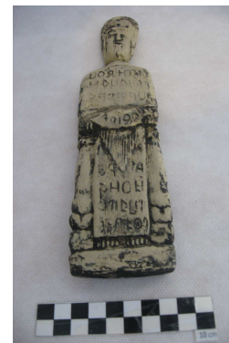
Fig.28 – estatueta celtibérica

Esta estatueta de barro designada de celtibera, é um objecto cujo estudo não permitiu obter conclusões sobre o mesmo. Pelos dados disponíveis na Ficha de Inventario do MNSR (ver Anexo C, Nº10) é uma peça do MMP aparecendo referida no Guia do Museu Municipal do Porto de 1902 (ver Anexo C, Nº12) e ainda no Inventário realizado pelo MMP em 1938/40 com o Nº14 (ver Anexo C, Nº3). As informações disponíveis dizem que esta peça foi incorporada em 1835 no Museu Allen e provém do Alentejo.