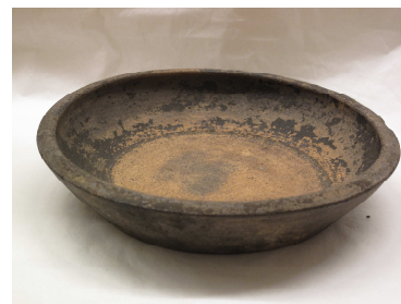
Fig.19 – Prato