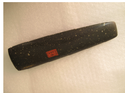
Fig. 11 – Enxó (?)

Este objecto aparece como pertencente à secção de Diversos do MMP (ver Anexo C, N°4), tendo como designação corta papel. Da etiqueta de cor geranium, e de acordo com os dados consultados sobre a etiquetagem do MMP, trata-se de um objecto que foi oferecido.