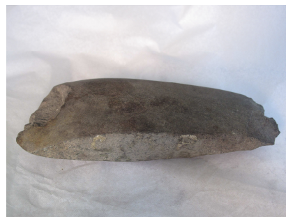
Fig.9 – Machado de pedra

Em relação a este instrumento, confirma-se tratar-se de um machado em pedra, cuja cronologia enquadrar-se-á no Neolítico/Calcolítico, de acordo com outros objectos análogos que encontramos. Relativamente a este objecto os escassos elementos disponíveis, baseiam-se no resto da etiqueta que possui, em tom de café, com o N°120, que levanta a hipótese de se tratar do machado referido no inventário do MMP de 1938/1940 (ver Anexo C, N°3) que refere o N°120 como sendo um de dois machados provenientes de Castelo de Vide e que possuía uma data de 1909.