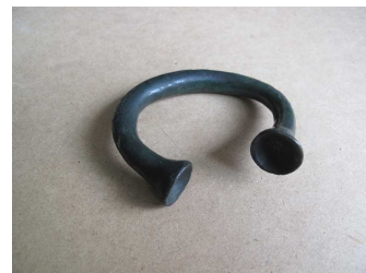
Fig.25 – Bracelete aberta

Trata-se de um objecto pertencente ao MMP, como se pode constatar através do N° de inventário constante na Ficha de Inventário do MNSR (ver Anexo C, N°10), além de que se encontra referenciado na obra “Machados e outros objectos de bronze”, editado pelo MNSR em 1946, que o aponta como sendo o N° 13 do Guia do Museu Municipal do Porto, de 1902 (ver Anexo C, N°12). Está ainda referenciado no Inventário realizado pelo MMP em 1938/40 com o N°161 (ver Anexo C, N°3).