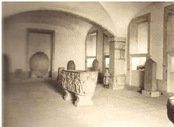
Fig.5 – Sala de arqueologia MNSR (AAVV, Roteiro da Colecção: Museu Nacional de Soares dos Reis. Ministério da Cultura, IPM, 2001, pp.25)

Após a passagem de toda o espólio para o Palácio dos Carrancas, e após as obras de adaptação do Palácio para museu, o MNSR ficou organizado em várias salas expositivas, entre elas uma sala destinada à arqueologia, como se pode ver na fotografia X. Das pesquisas realizadas, não se conseguiu apurar até quando esta sala existiu, mas sabe-se pelo descrito no roteiro da colecção do MNSR 81 que até ao início da década de 90, as modificações realizadas na organização do museu foram poucas.