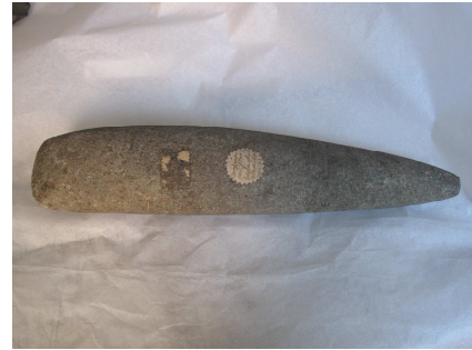
Fig.10 – Machado polido em anfibolito