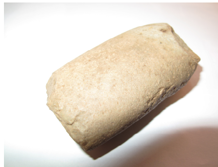
Fig.7 – Fragmento de machado polido

Relativamente a este objecto, as informações existentes na ficha de inventário do MNSR são praticamente inexistentes (ver Anexo C, N°10). Além de não permitir a contextualização arqueológica do objecto, pois desconhece-se a sua proveniência também não foi possível traçar o seu percurso até à chegada ao MNSR. A documentação consultada não permitiu averiguar a incorporação deste objecto no museu, nem se pertencia ao MMP. Desta forma o estudo realizado