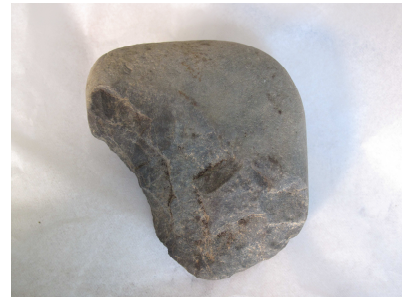
Fig.8 – Núcleo sob seixo de quartzito