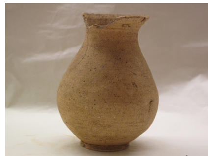
Fig. 18 – Copo

Este objecto tem um percurso de investigação muito idêntico ao anterior, visto tratar-se de mais um dos objectos oriundos de Paços de Ferreira. Este porém possui informações mais concretas, pois possui um papel associado ao objecto, onde se pode ler que foi oferecido pelo Dr.