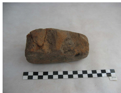
Fig.13 – peso de tear

Trata-se de um peso de tear da época romana que pertencia ao MMP. Possui uma marcação a lápis com o nº 52, e de acordo com o inventário realizado pelo MMP em 1938/40 (Anexo C, N°3) e com a ficha de inventário do MMP (Anexo C, N°11) existente, onde refere que do nº51-54 se trata de fragmentos cerâmicos e um peso de tear, pressupõe-se que este será o peso de tear em questão.