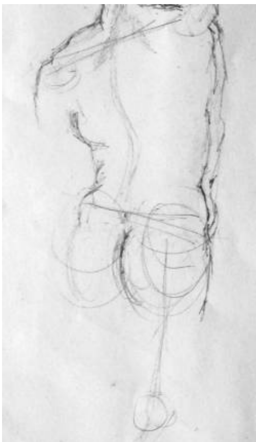
1. “Isabel”, A3 (fragmento), esferográfica 5

O universo dos materiais passíveis de serem utilizados na prática do Desenho, embora não tenha a capacidade de transformar o ductus do desenhador, condiciona inevitavelmente a sua relação com o Desenho. Contudo, é o “graficar” do desenhador que, quando domina os meios técnicos, os manipula e os utiliza a favor da sua subjetividade, portanto, o domínio dos materiais deve ser parte integrante da aprendizagem do Desenho. No entanto, tendo em conta que, num contexto escolar, a experiência dos alunos neste campo ainda é diminuta, deve-se ter em conta que a escolha dos materiais pode determinar os resultados dos exercícios. De qualquer modo, considera-se premente que o discente, numa fase inicial da aprendizagem, tenha oportunidade de experimentar um vasto leque de materiais.