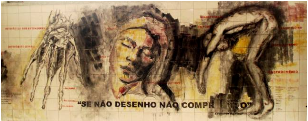
6. Aspeto do painel cerâmico realizado pelo 10º ano, após a cozedura.