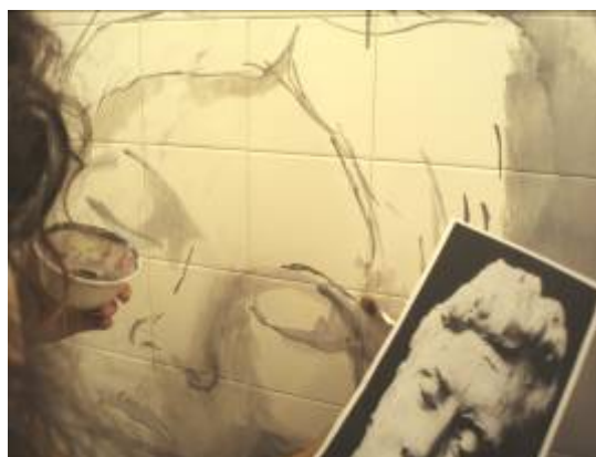
4 e 5 Execução do painel cerâmico, alunos do 10º ano.

Identificam-se, neste projeto, uma fusão de inquietações intrínsecas ao trabalho docente: uma aprendizagem alargada e o desenvolvimento integral do aluno através de experiências estimulantes que permitam um envolvimento pleno e uma visão mais global da realidade. Embora a eficácia desta fusão seja subjetiva, o estudo desenvolvido em estágio permitiu dar-lhe consistência e credibilidade. É neste tipo de experiências coletivas que o indivíduo se conhece e se afirma enquanto sujeito singular, como diria Edgar Morin (2005) partindo do princípio hologramático, “tudo é parte”, ou seja, tal como o aluno integra um coletivo, em cada aluno também se encontra a totalidade desse mesmo coletivo.