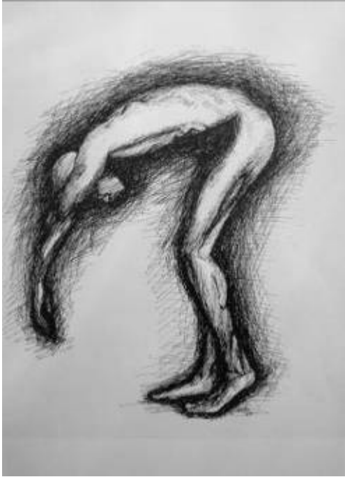
2. “Maria”, A3, esferográfica

Tendo em conta as dimensões do painel e por uma questão de ética, apenas se projetaram desenhos realizados pelos alunos. Logo, este painel representa a materialização de todo o trabalho realizado ao longo da referida unidade didática.