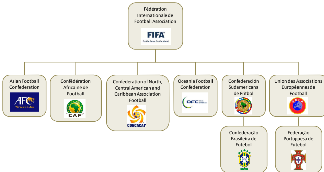
Figura 1: FIFA e suas Confederações