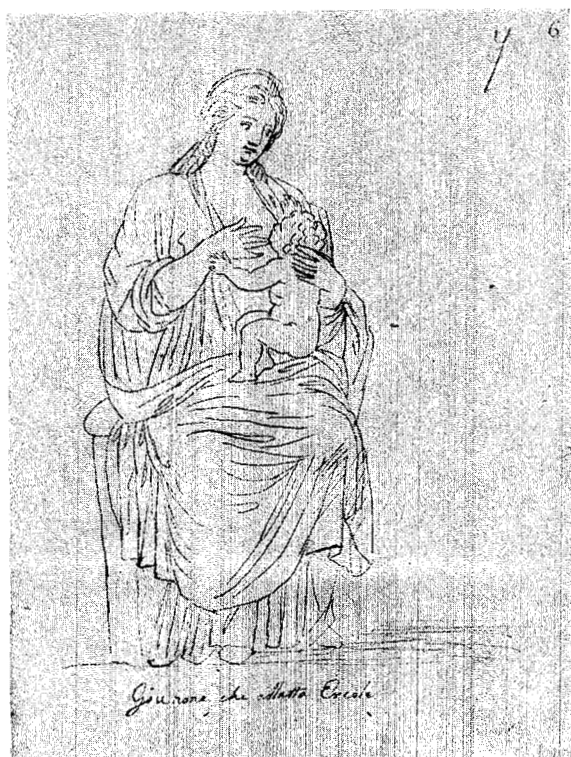
FIG. 5 — J. Teixeira Barreto — Álbum do M. N. Soares dos Reis — Desenho à pena de «Giunone che a latta Ercole».