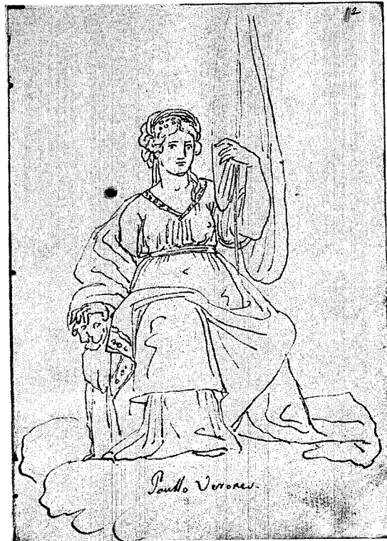
FIG. 3 — José Teixeira Barreto — Livro B, fls. 12. Cópia à pena, de Veronese (Triunfo de Veneza ?).