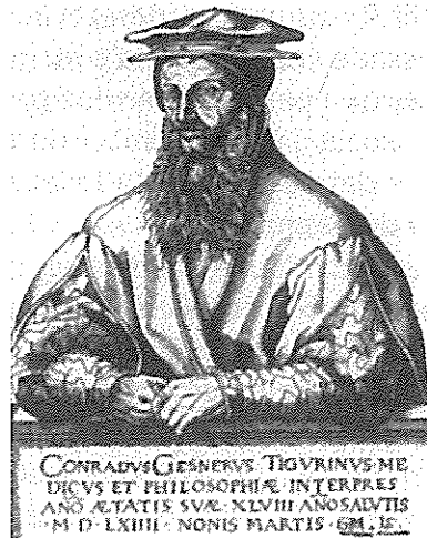
O bibliógrafo Conrado Gesner (CEHLE)

como Petrus Hispanus Portugalensis , ademais identificado como papa (embora não diga qual):