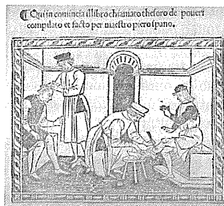
À esquerda, pormenor de uma edição de Pedro Hispano, Thesaurus Pauperum , em tradução para a língua italiana, de fins do século XV; à direita, frontispício de Thesaurus Pauperum , na edição de 1530