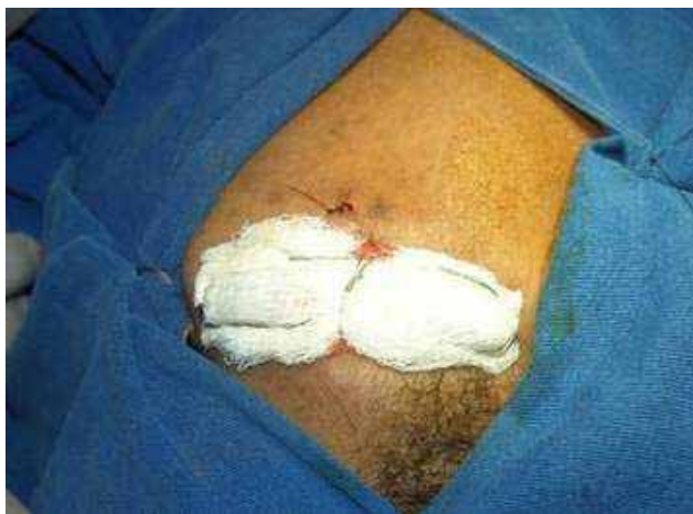
Fig. 7 – Disposição final da contenção.

A imagem radiográfica pós-operatória (Figura 8) demonstrou a correta redução da fratura. A contenção mostrou-se eficaz e foi mantida por três semanas, sendo retirada sob anestesia local.