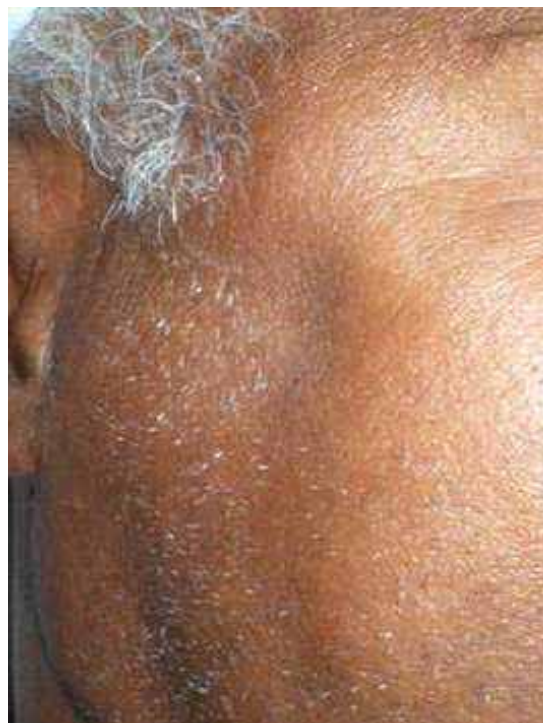
Fig. 1 – Depressão na região, sugestiva de afundamento do arco zigomático.

Paciente do sexo feminino, 58 anos de idade, feoderma, foi atendida no Serviço de Cirurgia e Traumatologia Bucomaxilofacial, do Instituto Bahiano de Ortopedia e Traumatologia em Salvador/BA, com história de agressão física em região lateral da face. Ao exame, apresentava afundamento zigomático, lado direito, que comprometia a estética sem, contudo, prejudicar a abertura bucal (figura 1).