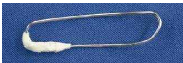
Fig. 4 - Fio de Kirschner n.º 1,5 dobrado.