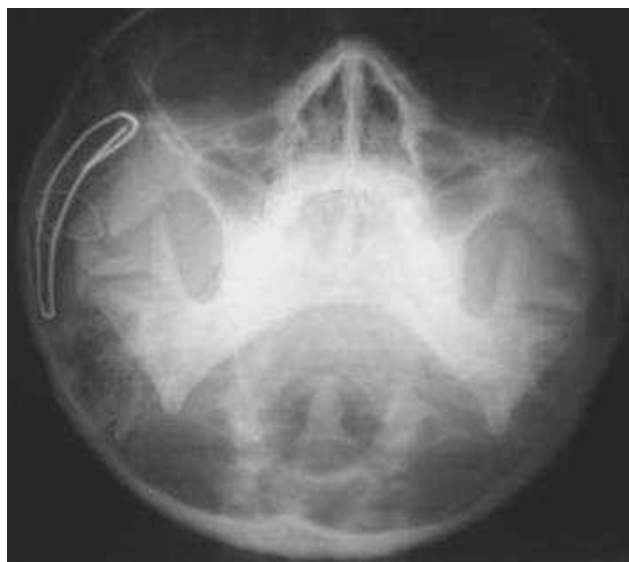
Fig. 8 – Controle radiográfico pós-operatório imediato. Observa-se a redução da fratura do arco zigomático.

A imagem radiográfica pós-operatória (Figura 8) demonstrou a correta redução da fratura. A contenção mostrou-se eficaz e foi mantida por três semanas, sendo retirada sob anestesia local.