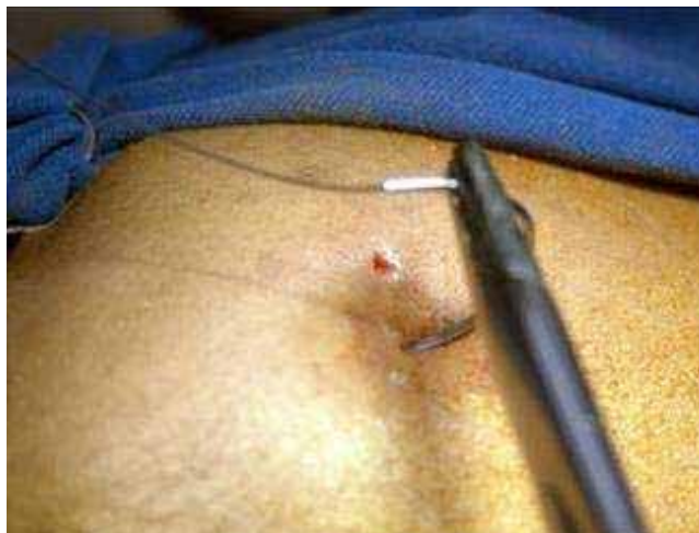
Fig. 5 - Transfixação com agulha curva montada com fio de aço n.º 2.

Após a cerclagem com o fio de aço, o fio de Kirschner foi adaptado sobre a pele protegida por gaze estéril e realizada a amarra com o fio flexível n.º 2, de maneira a conter a redução da fratura (Figuras 6 e 7), seguida de curativo.