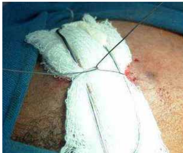
Fig. 6 - Dispositivo de contenção. Após passado o fio de aço n.º 2, as extremidades são unidas superiormente. O local é protegido por compressa de gaze.

Após a cerclagem com o fio de aço, o fio de Kirschner foi adaptado sobre a pele protegida por gaze estéril e realizada a amarra com o fio flexível n.º 2, de maneira a conter a redução da fratura (Figuras 6 e 7), seguida de curativo.