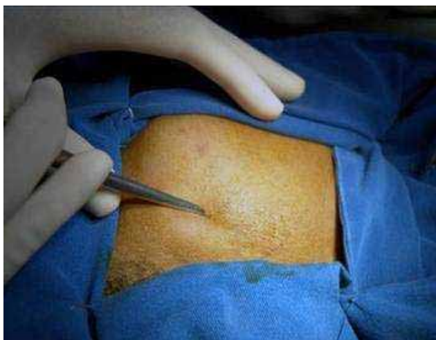
Fig. 3 - Redução da fratura com gancho de Ginestet.

Foram utilizados: fio de aço agulhado n.º 2; fio de Kirschner n.º 1,5 modelado em forma de duplo “U” e dobrado na forma da convexidade do arco zigomático (Figura 4). Após a redução com o gancho de Ginestet (Figura 3), transfixou-se a pele com a agulha montada do fio de aço, passando sob o arco zigomático reduzido, no sentido ínfero-superior (Figura 5).