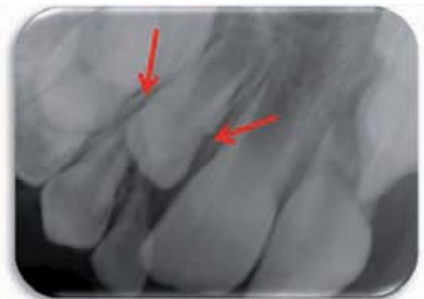
Figura 3. Imagen radiológica de la alteración en la formación de la corona del lateral permanente por el impacto del diente temporal

Esta infección suele tardar varias semanas en manifestarse, clínica y/o radiológicamente. No puede verse, o preverse, en la exploración realizada inmediatamente después del traumatismo y, de hecho, es una complicación muy frecuente aunque en una primera exploración y evaluación no parezca haber lesiones.