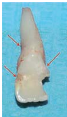
Figura 8 A-D. Alteraciones múltiples, consecuencia de avulsión traumática del diente temporal ocurrido 7 años antes y otros traumatismos posteriores. En A y B se observa la dilaceración coronaria enmascarada por la importante lesión en la formación de la corona cronológicamente concordante con el golpe inicial. En C y D se confirma esta anomalía y se detecta la desviación en la dirección de formación de la raíz consecuencia de traumatismos posteriores