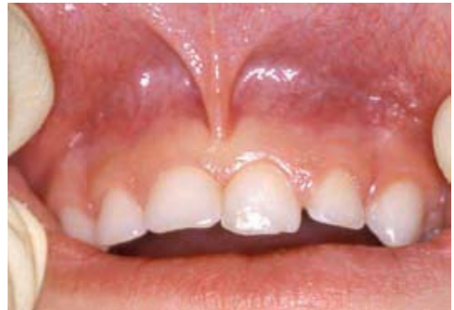
Figura 1. Fracturas pequeñas en la corona de los incisivos temporales de origen traumático. En el incisivo izquierdo puede observarse una luxación extrusiva con la consiguiente lesión del ligamento periodontal

— Tiempo transcurrido desde que se produjeron las lesiones hasta que acudió a la consulta dental. Ello determinará frecuentemente el pronóstico de la afectación periodontal y de la vitalidad