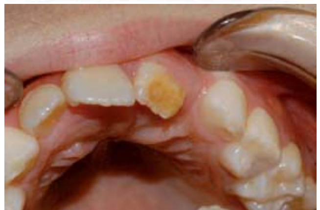
Figura 10 A-D. Intrusión de 61 ocurrida a los 18 meses de edad. Nueve meses más tarde (A) comienzan a apreciarse radiológicamente los problemas. Al cabo de los años se concretan en una dilaceración y alteración de la estructura coronaria de 21 y evolución del germe de 22 hacia la formación de un odontoma (B) que se eliminó (C). En D se visualizan las alteraciones de 21, después de su emergencia