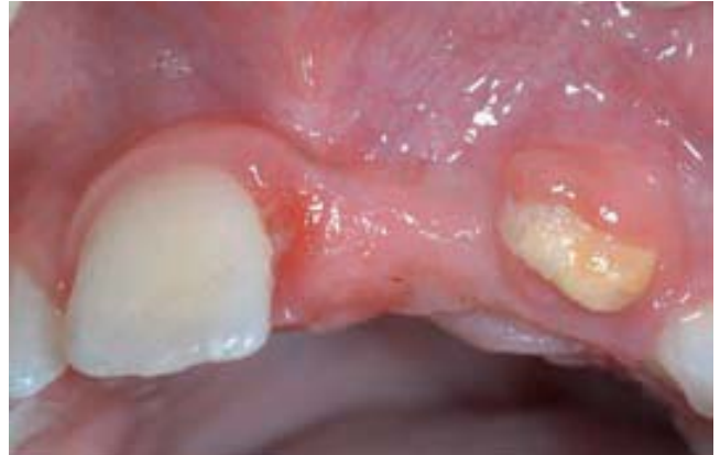
Figura 9 A-B. Detención completa de la formación de la raíz de 21 que no ha llegado a erupcionar espontáneamente (A). Radiológicamente se visualiza alteración en la formación coronaria de 21 y 22 que se confirma en 22 después de la emergencia (B). La alteración del crecimiento óseo y de la oclusión está asegurada.