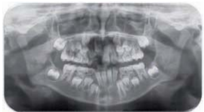
Figura 11 A-C. Alteración de la cronología de la erupción por traumatismo antiguo en el diente temporal (A-B). Se realizó una exposición quirúrgica para facilitar la emergencia de 11 y 12. Una vez que han hecho emergencia pueden apreciarse las alteraciones de estructura (C)