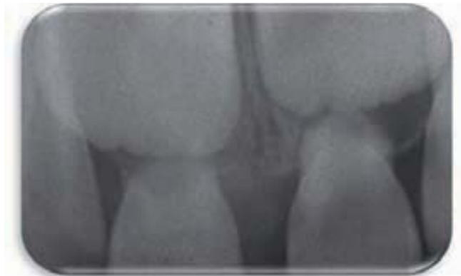
Figura 6 A-B. Lesión pardo-amarillenta por alteración de la mineralización (A). En B se observa la radiografía obtenida tras el traumatismo donde se ve la estrecha relación entre el ápice del temporal y el permanente

po en manifestarse. Un plan de revisiones, en la secuencia adecuada, evitará que las complicaciones derivadas de esto pasen inadvertidas e impedirá el agravamiento de las lesiones producidas por el impacto directo.