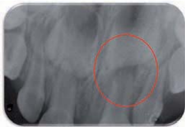
Figura 4 A-B. Foco infeccioso en ápice de 61 (Figura 4 A). Años más tarde la corona de 21 muestra las lesiones de formación (B)