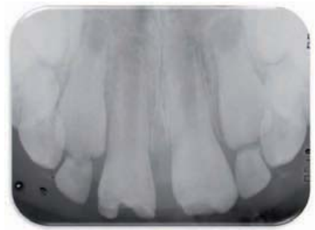
Figura 7 A-C. Déficit de formación de una parte de la corona dentaria, de 11, por disrupción irreversible de los tejidos formadores de esa parte de la corona y alteración menor pero importante en 21 con gran compromiso estético (A-B). La radiografía (C) confirma las lesiones y muestra el estadio de formación radicular