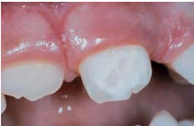
Figura 5. Alteración de la mineralización manifestándose con manchas blancas en la corona del incisivo

Lo anterior hace necesario planificar, en todos los traumatismos, el seguimiento profesional periódico de la evolución del traumatismo, hasta la exfoliación del temporal. En ningún caso es posible afirmar, con una exploración única, "no ha pasado nada, el golpe no tiene importancia" ya que el fracaso pulpar tardará tiem-