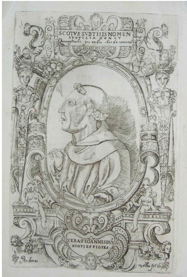
A EFÍGIE DE DUNS ESCOTO