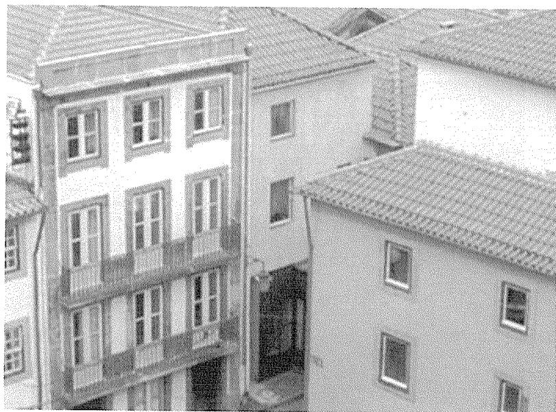
Fig. 2 – Casas do Largo do Colégio, junto ao topo Este da Rua de Santana, antes e após a sua recuperação.