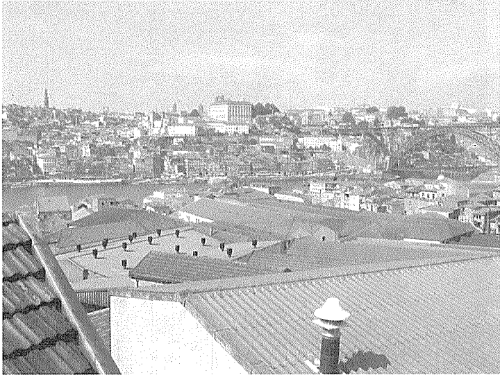
Fig. 3 – Aspecto parcial das caves de Vila Nova de Gaia que se estendem entre a proximidade da Ponte D. Luís e o Morro do Castelo. Aqui, a homogeneidade formal e funcional, mascaram uma profunda diversidade, a que não faltam intrusões arquitectónicas, facilitadas pela ausência de acompanhamento especialmente direccionado ao tecido antigo.