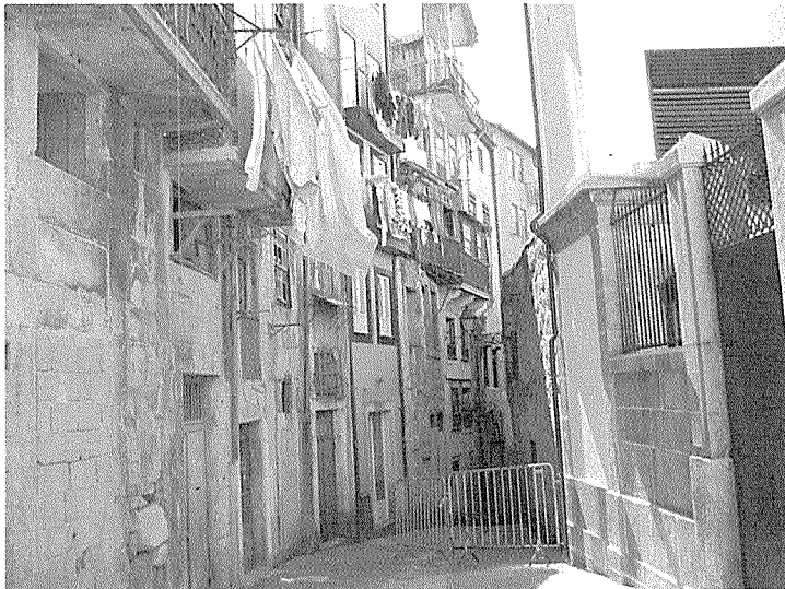
Fig. 4 – Viela do Anjo: um dos muitos locais onde é forte o contraste entre o que foi recuperado e o que faz falta recuperar.