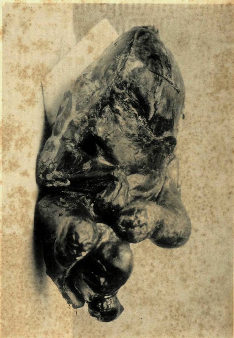
Feto visto pela face anterior