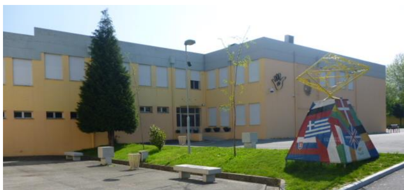
Figura 1 - Escola Básica 2,3 de Lamações

No ranking de escolas nacionais lançado pelo Observador, em 2022, a Escola Básica de Lamações ficou colocada em 426º (52% de Média no Exame Nacional, 3,11 de Média Interna) em 1177 lugares possíveis, encontrando-se em 17º lugar no Ranking Local.