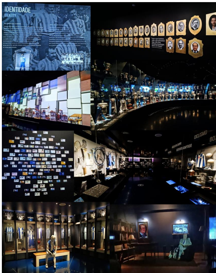
Figura 1 – Museu FC Porto