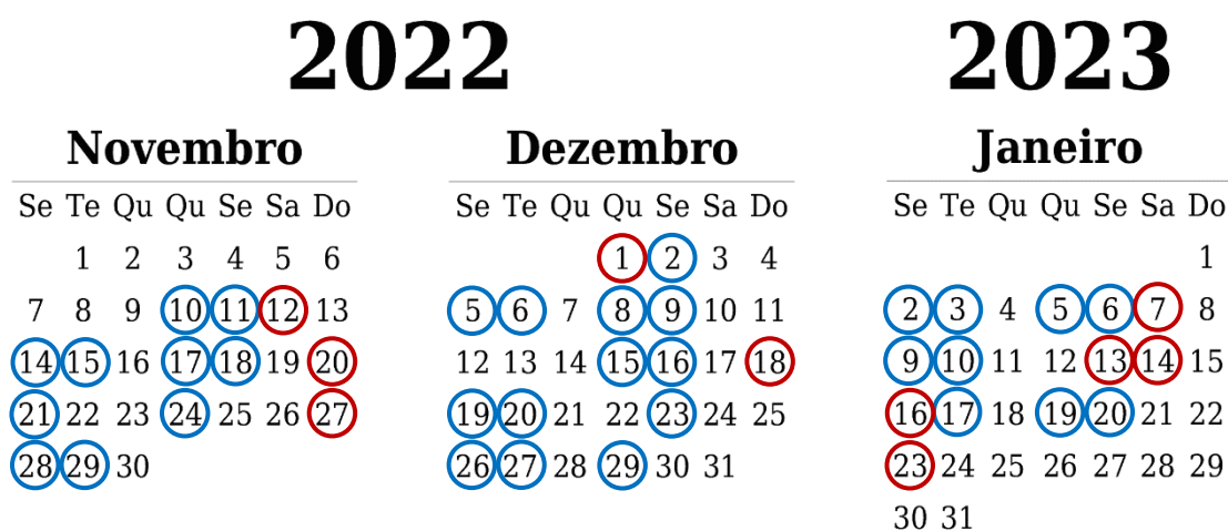
Figura 1. Calendário da monitorização das cargas em treino (azul) e jogo (vermelho).

De seguida, iniciou-se o processo de monitorização das CI e CE acumuladas pelos jovens basquetebolistas durante os treinos e jogos oficiais. Ao longo de um período de 10 semanas consecutivas, entre novembro de 2022 e janeiro de 2023, os jogadores foram monitorizados em 32 treinos e 10 jogos oficiais (Figura 1), contabilizando um total de 316 e 95 observações individuais, respetivamente.