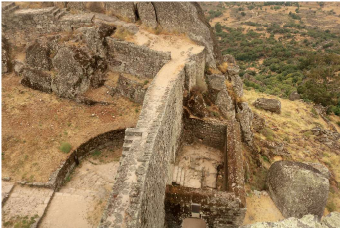
Porta norte com barbã de porta manuelina