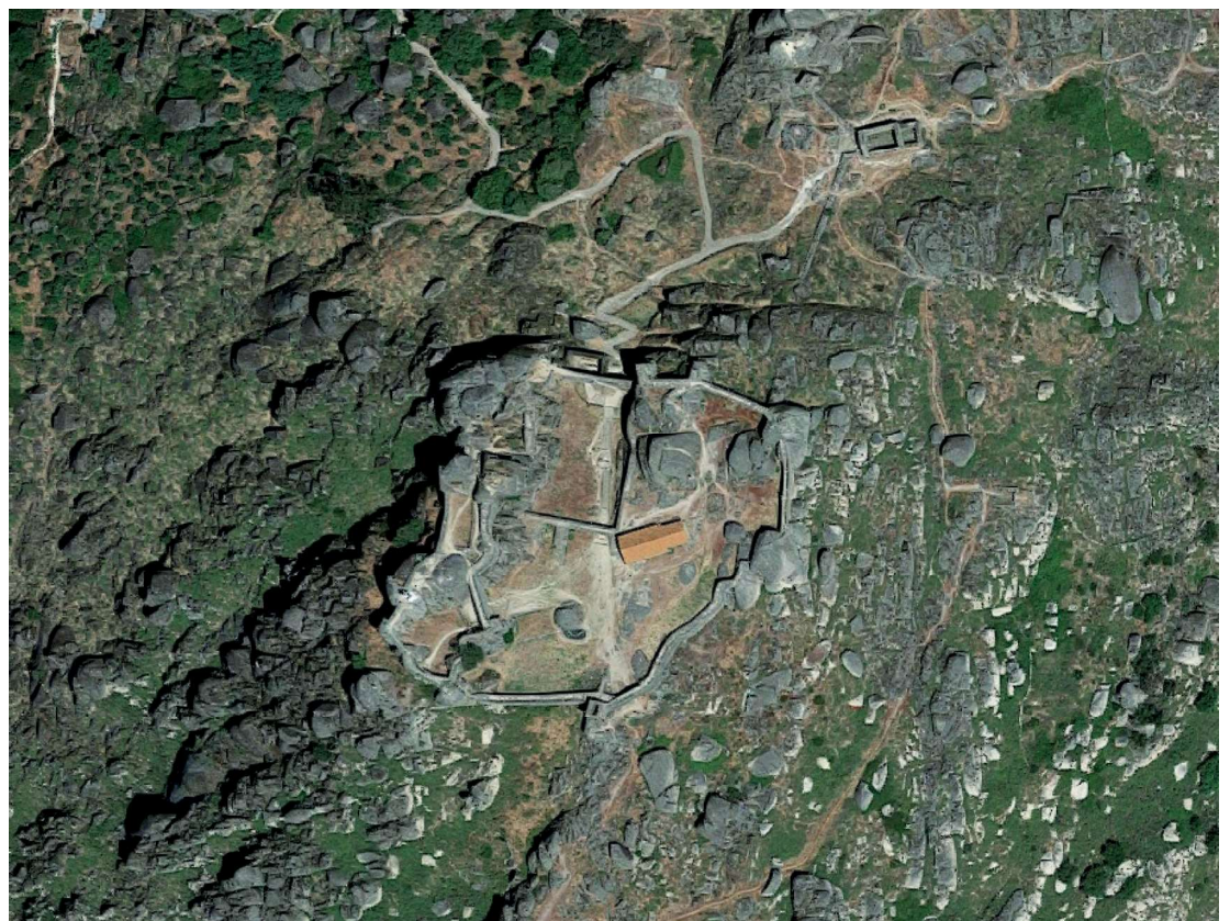
Perspetiva aérea do castelo de Monsanto

Recaredo (586-601) e de Sisebuto (612-621). Mas a sua localização exata continua a suscitar algumas dúvidas. As mais antigas referências diretas a Monsanto, e ao seu castelo, encontram-se na crónica do mouro Razi, que aponta o hisp beirão como um exemplo de "forte castelo". Situado no território a leste da Serra da Estrela, Monsanto é um caso paradigmático das dificuldades que a coroa portuguesa