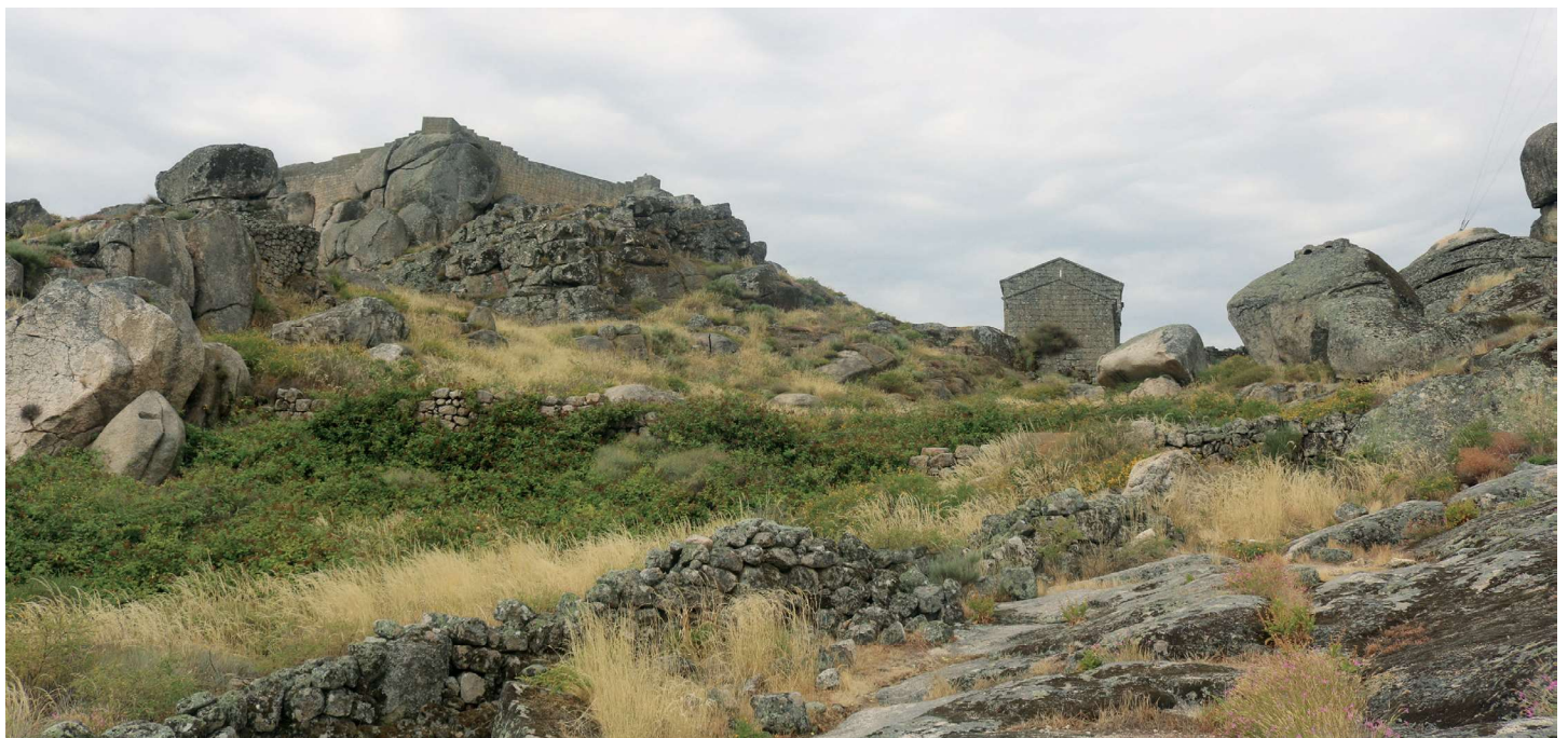
Perspetiva geral da implantação da igreja a partir de este. A sul, o castelo de Monsanto

Apesar de as campanhas arqueológicas em Monsanto revelarem material pré-romano, como dois machados em bronze e várias joias de prata, não é certa a ocupação efetiva do local onde se ergue a igreja de São Miguel nesse período, que deveria estar circunscrito a uma cota mais baixa. Contudo, sabe-se que, por Monsanto, passava a via romana que de Braga seguia para Emerita . Em novembro de 1165, D. Afonso Henriques doa a D. Gualdim Pais, mestre Templário, a terra de Idanha-a-Velha e Monsanto, com a condição de a milícia servir o monarca e o seu filho. A doação da terra de Monsanto aos Templários e a subsequente construção do castelo visavam reforçar a defesa da linha de fronteira dos ataques Almóadas e do reino de Leão. Os freires do Templo edificaram aí também a ermida de Santa