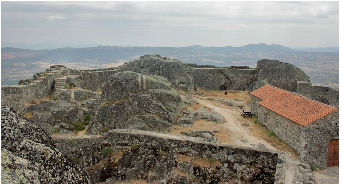
Sector nordeste do castelo