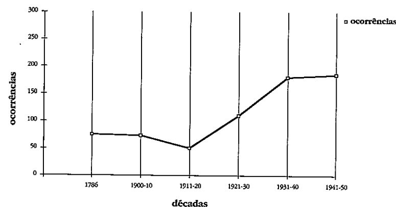
GRÁFICO nº 1 – Ocorrências Bibliográficas

Em suma, todo este espaço que medeia entre a Revolução Liberal e os anos 40 do Estado Novo é, do ponto de vista da protecção social em Portugal, um campo em aberto em que se ensaiam caminhos que pretendem romper com a tradição assistencial medieval em ordem a uma intervenção no social de tipo moderno.