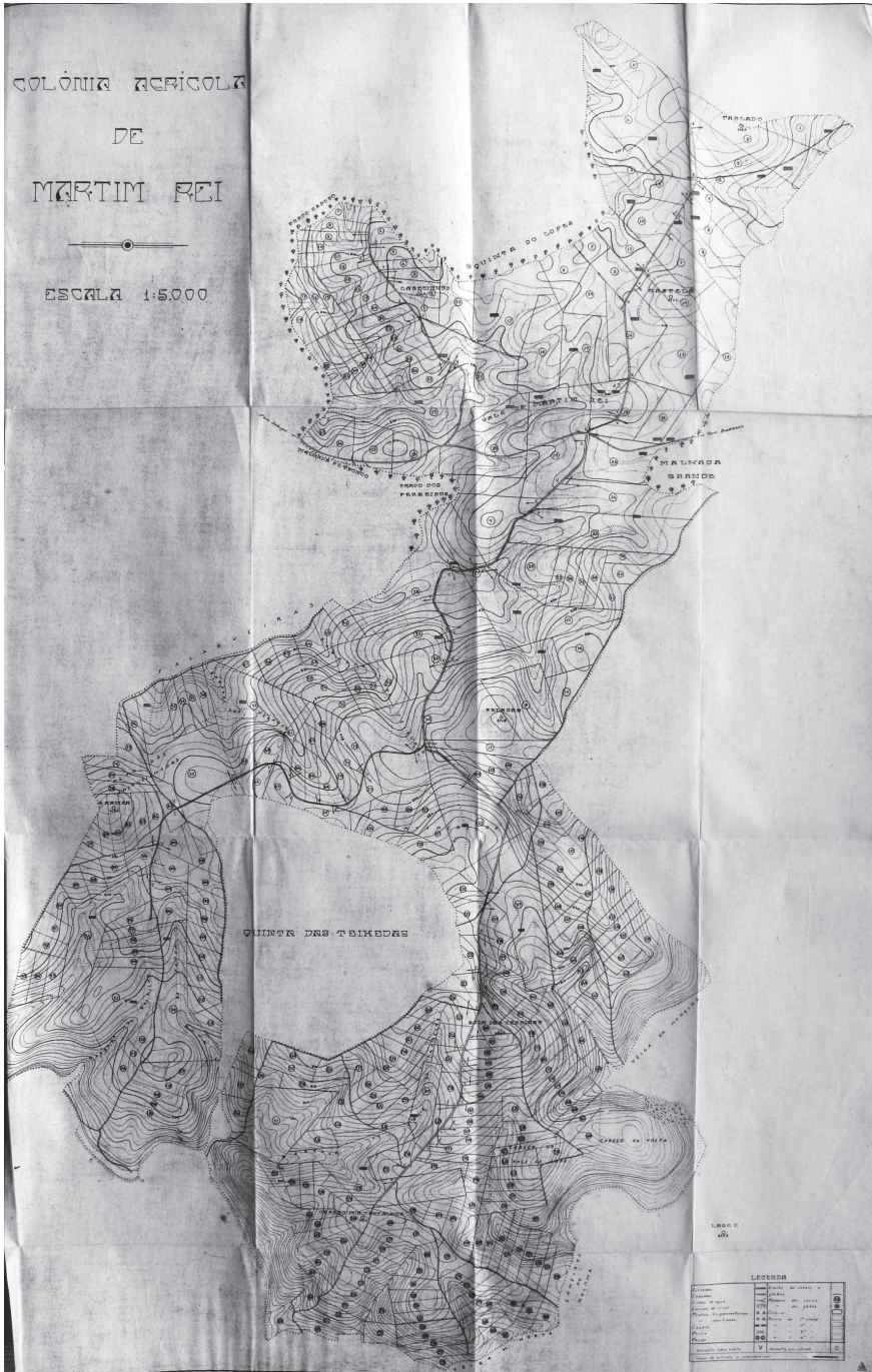
Fig.4 – Planta da Colônia Agrícola de Martim Rei (JCI, 1943a)