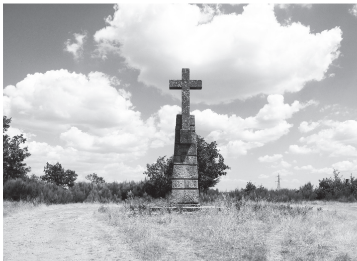
Fig. 7 — Cruzeiro (Guerreiro, 2010)

procurando estabelecer elementos que induzissem uma leitura de conjunto, fomentassem o sentido de comunidade e criassem condições para a prestação das várias áreas de assistência. No que respeita aos equipamentos, o edifício da assistência técnica 16 passou a integrar o posto médico-social 17 , foi construída a escola 18 e a capela 19 . Do ponto de vista do desenho da paisagem, e de um sentido de representação da colónia, foi construído o chafariz – mirante 20 e o cruzeiro. Estes equipamentos, implantados junto ao cruzamento da estrada Sabugal – Quadrazais com as estradas de penetração dos Baldios, desenham um conjunto em torno do vale de Martim Rei cuja presença funciona como uma ‘porta’ da colónia, assinalando a sua presença na estrada. Presença afirmada, nos anos seguintes, por uma intensa operação de arborização 21 .