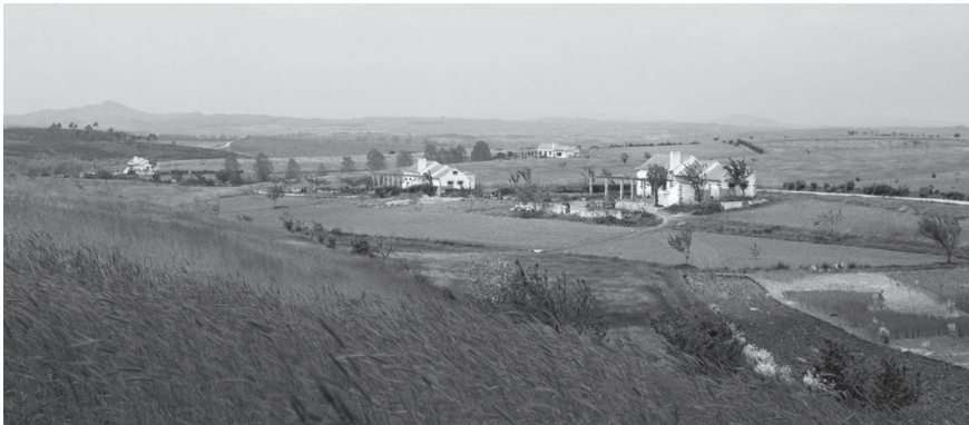
Fig. 10 — Os casais após a construção das pérgulas.

A proposta final estabeleceu como princípio a consideração do pátio de lavoura como elemento estruturante do conjunto edificado. O edifício decorre da justaposição de vários volumes, cada um desenhado e dimensionado exclusivamente em função das condições e necessidades da sua função, não existindo qualquer concessão ou elemento de relação que permita uma articulação com os restantes. Esta condição da composição, e o facto de não se encerrar todo o perímetro do pátio, permitiria que se acrescentasse em qualquer momento outro volume.