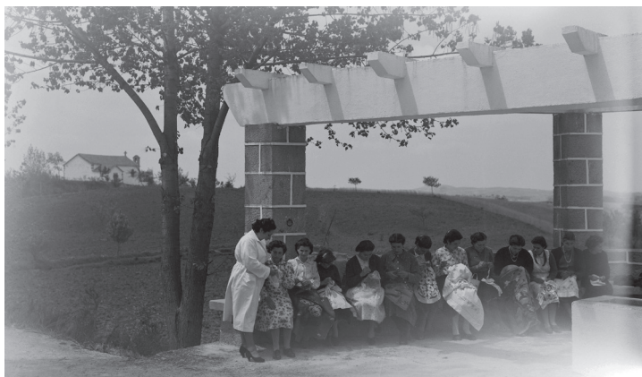
Fig. 6 — Aula de bordados sob o miradouro

procurando estabelecer elementos que induzissem uma leitura de conjunto, fomentassem o sentido de comunidade e criassem condições para a prestação das várias áreas de assistência. No que respeita aos equipamentos, o edifício da assistência técnica 16 passou a integrar o posto médico-social 17 , foi construída a escola 18 e a capela 19 . Do ponto de vista do desenho da paisagem, e de um sentido de representação da colónia, foi construído o chafariz – mirante 20 e o cruzeiro. Estes equipamentos, implantados junto ao cruzamento da estrada Sabugal – Quadrazais com as estradas de penetração dos Baldios, desenham um conjunto em torno do vale de Martim Rei cuja presença funciona como uma ‘porta’ da colónia, assinalando a sua presença na estrada. Presença afirmada, nos anos seguintes, por uma intensa operação de arborização 21 .