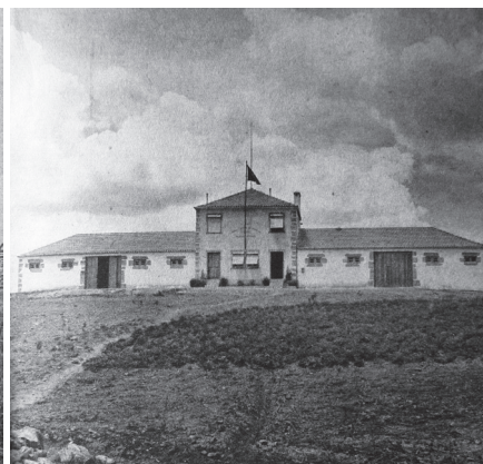
Fig. 2 — Edifício da assistência técnica – Eng. Dâmaso Constantino, 1937 (SNI [1945])