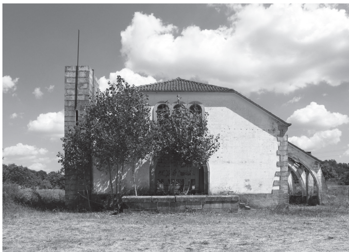
Fig. 8 — Adega (Guerreiro, 2010)

Se, com excepção da escola, estes primeiros equipamentos, à semelhança dos edifícios dos casais, foram projectados por Engenheiros Cívicos, sem preocupações relevantes do ponto de vista arquitectónico, no momento seguinte, na década de 1950, os equipamentos de apoio à produção agrícola, especialmente a queijaria 22 e a adega 23 passam a deter uma qualidade construtiva e uma intencionalidade e expressão de desenho, quer do objecto, quer da sua integração no conjunto, assinaláveis.