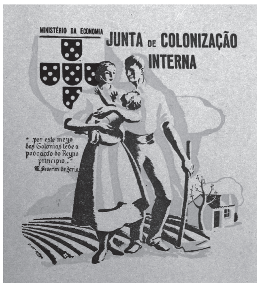
Fig. 1 – Logotipo da Junta de Colonização Interna

O programa colonizador do Estado Novo representava também uma base para a defesa dos valores e divisas que caracterizavam o regime do Estado Novo — a família, a propriedade, a ruralidade, a exaltação da nação, a expansão da raça e a valorização do território. A ideia central agregadora do programa será a do apelo à terra e à propriedade, associada a uma ideia de refundação da nação, sublinhando as virtudes de um Portugal rural de “estagnação programada” (Cabral, 1976:893). A fundamentação ideológica do papel central da agricultura na fixação da população, construção, defesa e economia da nação, cruza referências das experiências em desenvolvimento, no mesmo período, na Itália fascista,