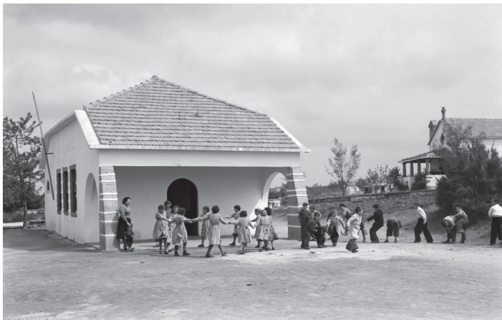
Fig. 5 — Escola – arq. Rogério de Azevedo [?]- e Capela – Eng. Dâmaso Constantino, 1943

No segundo momento de construção das colónias agrícolas da Junta [1942-1946] emerge o sentido civilizador do programa, e o seu papel enquanto suporte de representação ideológica do Estado, procurando não só exemplificar o que deveria ser o desenho do espaço rural, ancorado na tradição e refundação da nação, como também educar e disciplinar o quotidiano do Homem ideal do Estado Novo. A publicação de um número dos Cadernos de Ressurgimento Nacional relativo à Colonização Interna (SNI, [1945]), e os valores defendidos no concurso da Aldeia mais portuguesa de Portugal 15 , são um claro sinal deste entendimento que reclama para além de uma nova e qualificada concepção arquitectónica das colónias agrícolas, a inclusão de equipamentos para a assistência religiosa, educativa, médica e social. Neste período, o tema da paisagem adquiriu também uma elevada relevância para o Estado, expressa, por exemplo, na publicação do livro “Paisagem e monumentos de Portugal” (Santos, 1940) no contexto da Exposição dos Centenários, e, nos objectivos que António Ferro perseguia, através do Secretariado da Propaganda Nacional, de projectar o país para o turismo. Neste contexto, a construção das colónias agrícolas deixa de ser vista apenas como uma questão agrícola e passa a ser debatida à luz de outras disciplinas como a geografia, a religião e a educação, a arquitectura, e a arquitectura paisagística.