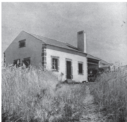
Fig.3 — Fotografia de um casal agrícola – Eng. Dâmaso Constantino, 1937 (SNI [1945])

Com estes critérios foram excluídos 272 utentes, ficando ainda 77 candidatos a colonos, o que inviabilizaria assegurar glebas para os restantes. Assim, numa segunda acção “eliminaram-se os indivíduos com residência própria, apurando-se então aqueles que, habitando em casa de favor ou de renda, não dispensassem a construção de moradia própria no Baldio” (JCI, 1937: 86). Por este processo, foram apurados 39 futuros colonos.