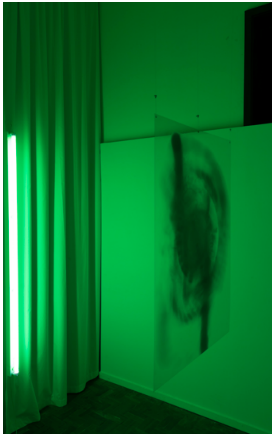
Instalação Na tentativa de unir todos os pontos