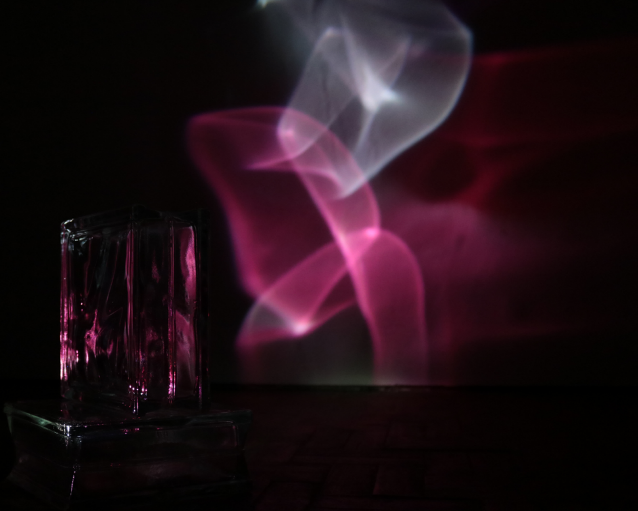
Instalação Daí Emergem