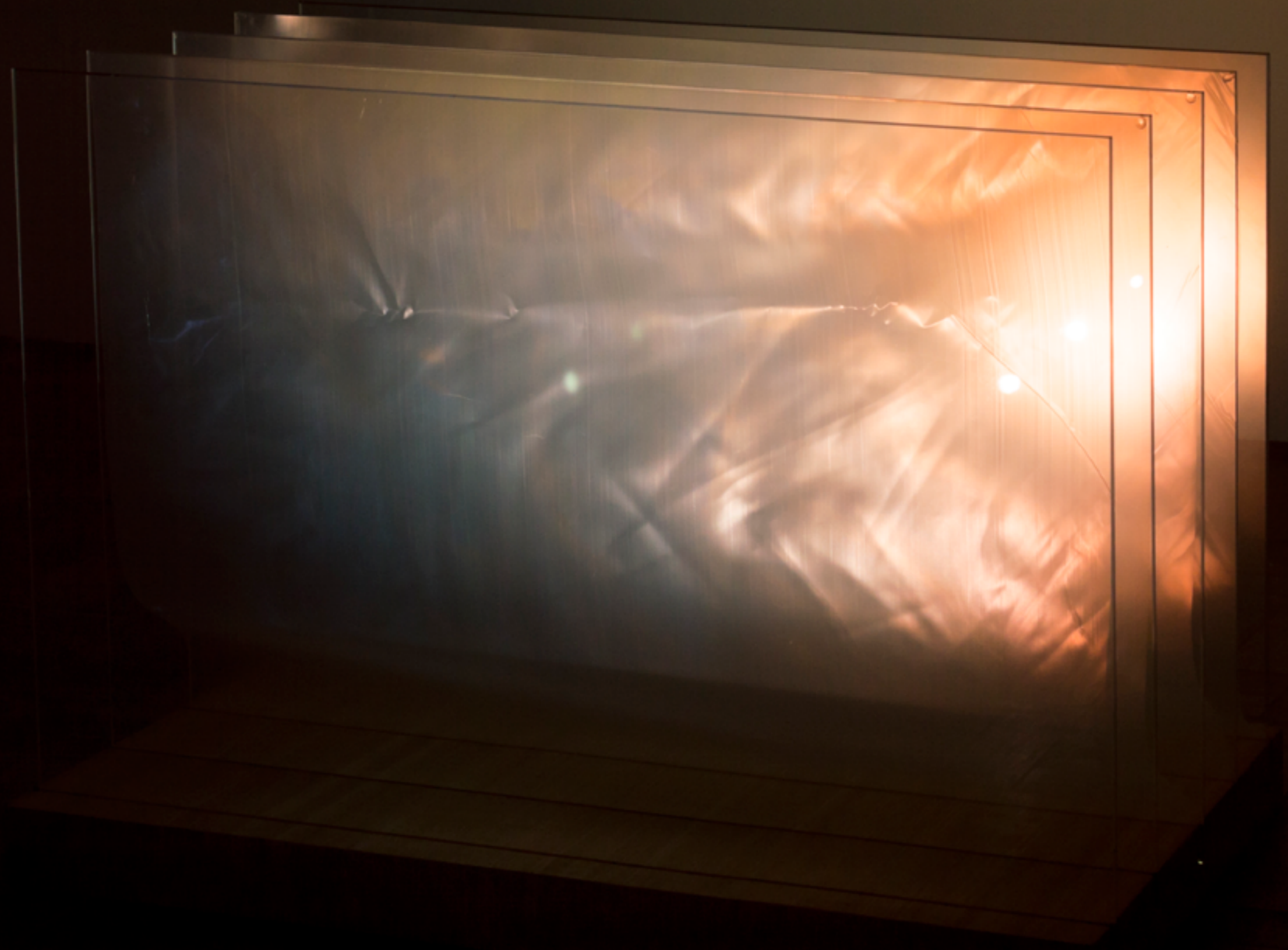
Instalação Não Permanece, Flutua