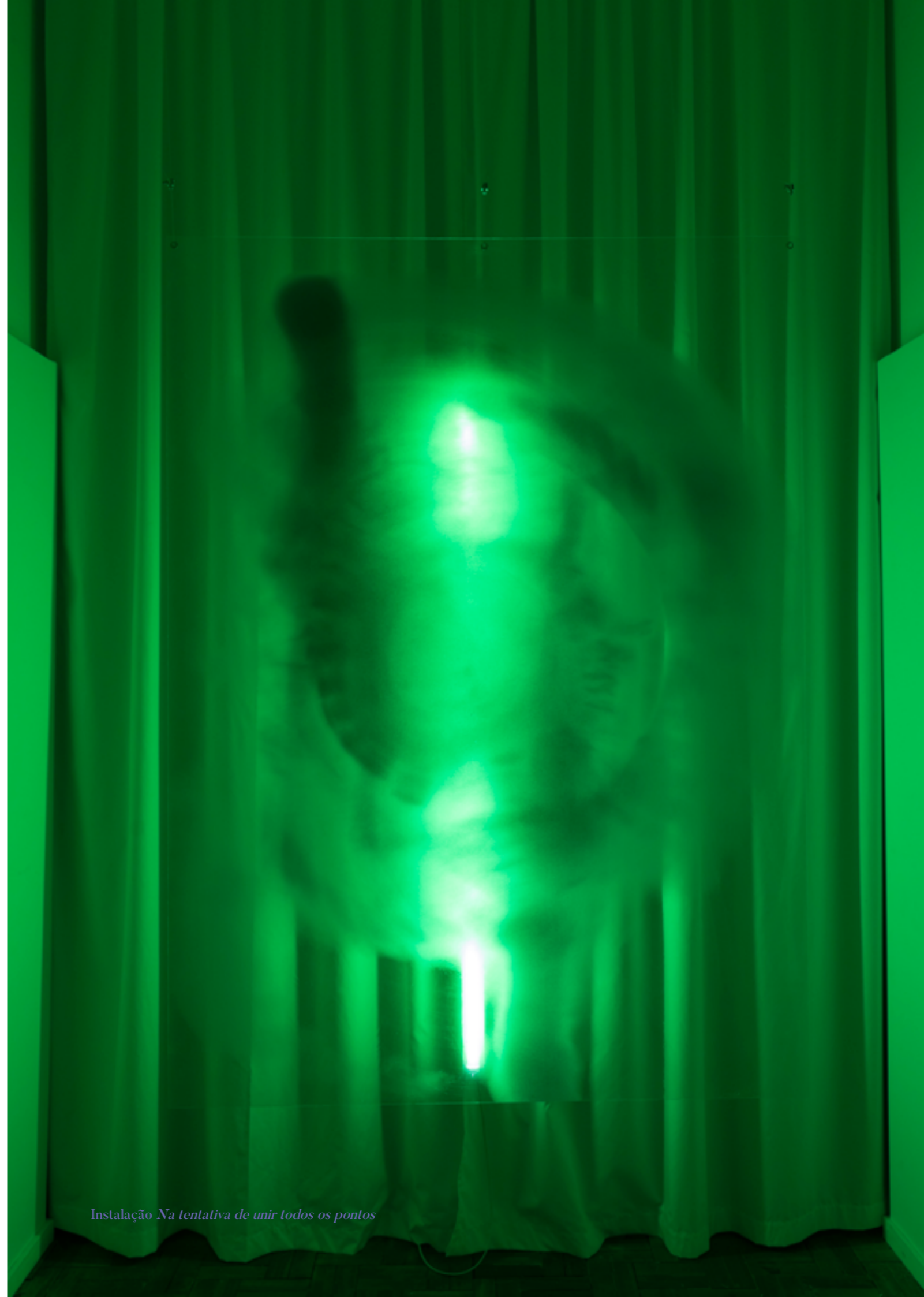
Instalação Na tentativa de unir todos os pontos