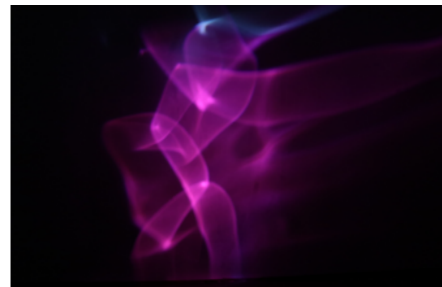
Projecção da instalação Dai Emergem