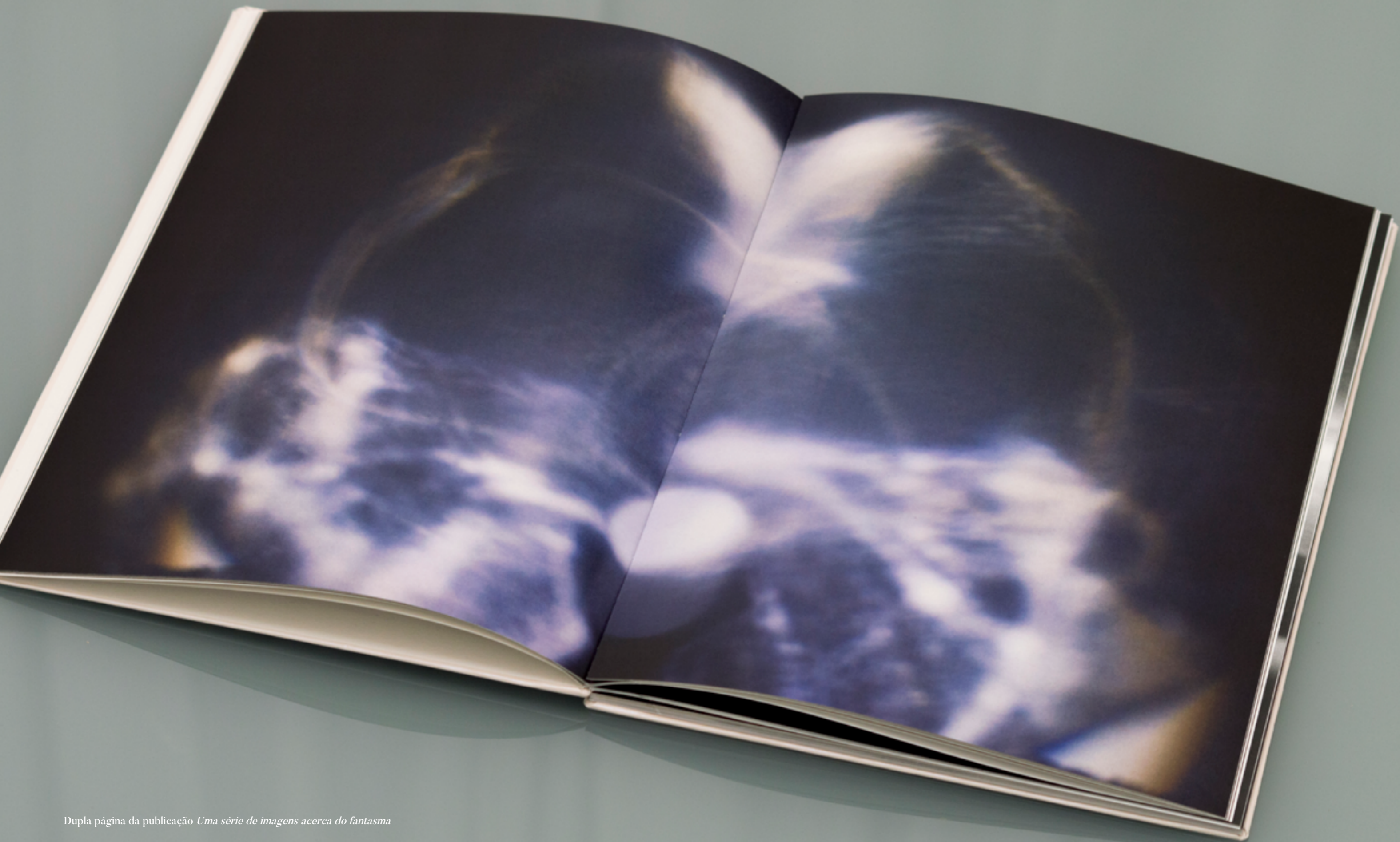
Dupla página da publicação Uma série de imagens acerca do fantasma