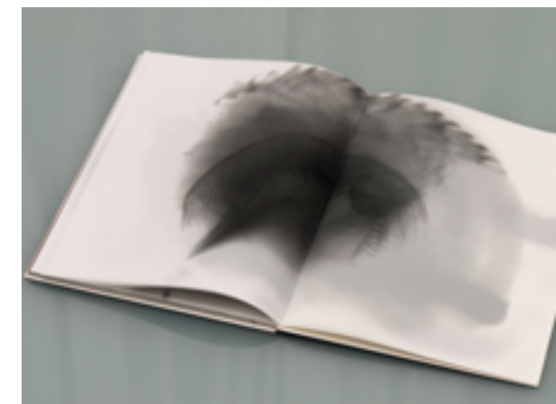
Dupla página da publicação Uma série de imagens acerca do fantasma

Este exercício tanto pensa a vontade de tratar a imaterialidade dos objectos tendo em mente as suas qualidades secundárias (1) e a possibilidade de um determinado evento, como a utilização da fotografia, ao explorar a condensação da virtualidade num objecto, em que o próprio produto de um processo de luz ocorre no dispositivo. Como Roland Barthes refere, a fotografia encontra-se entre dois processos “UM, DE ORDEM QUÍMICA, A ACÇÃO DA LUZ SOBRE CERTAS SUBSTÂNCIAS; O OUTRO DE ORDEM FÍSICA, A FORMAÇÃO DA IMAGEM ATRAVÉS DE UM DISPOSITIVO ÓPTICO” (BARTHES, 2010, 18), vai mais longe ainda ao categorizar a “FOTOGRAFIA DO SPECTATOR” (IBID), como a imagem física produzida, e a “FOTOGRAFIA DO OPERATOR” (IBID), a imagem produzida na câmara. O que estas afirmações nos propõem vai de encontro à necessidade de reconhecer a disjunção temporal que o processo de trabalho representa objectivamente. No exemplo concreto do medium fotográfico, a imagem do real, aquilo que vemos a dado momento no tempo, que se torna visível aos nossos