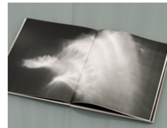
Dupla página da publicação Uma série de imagens acerca do fantasma

A publicação Uma série de imagens acerca do fantasma reúne então dois momentos de produção distintos mas que revolvem acerca das mesmas questões. Em primeiro lugar, a vontade de trabalhar a luz na sua imaterialidade pelo potencial que o seu comportamento representa em diálogo com outros elementos, nomeadamente os objectos de vidro utilizados, e as produções subsidiárias que advém dessa relação, que são elas próprias virtualidades imanentes desse evento. Em segundo lugar, as condições implícitas na utilização do medium, a fotografia neste caso, e como a formalização do objecto final, seja ele a fotografia inicial ou a impressão no livro, representam uma disjunção de um todo que se parte nos diferentes momentos da sua aparição ou experiência. O que se pretende pensar a partir de agora reconhece a relação anacrónica que se estabelece dentro da prática e experiência artística, desenvolvendo considerações acerca do papel do medium nessa operação e do que se extrai quando o trabalho é apresentado e posteriormente revisitado na memória.