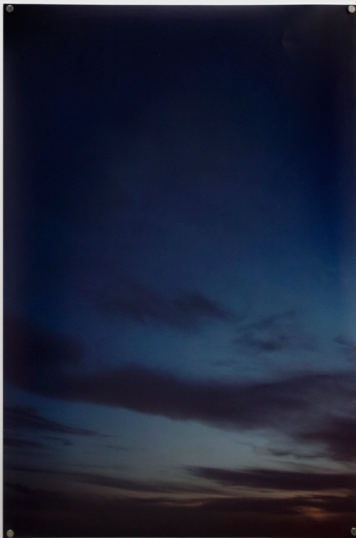
06:15 (esq) 20:48 (dir)