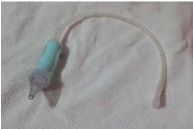
Figura 1: Bomba para aspirar conteúdo oro-nasal dos neonatos