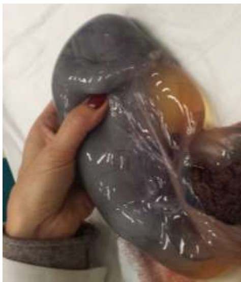
Figura 3: Como sentir o batimento cardíaco de um neonato