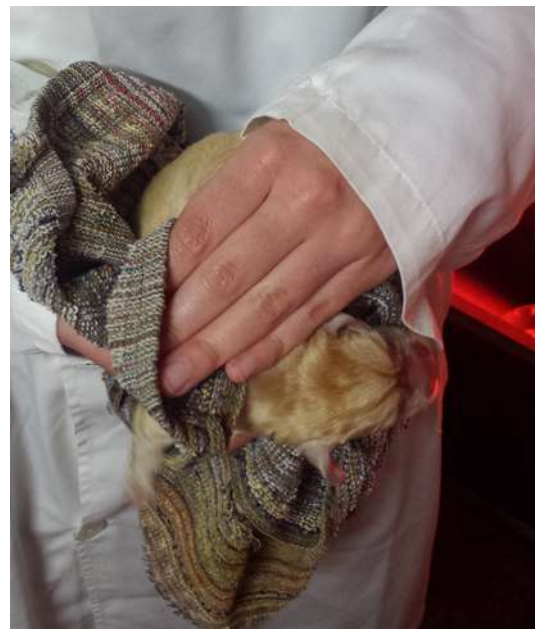
Figura 2: Ressuscitação neonatal