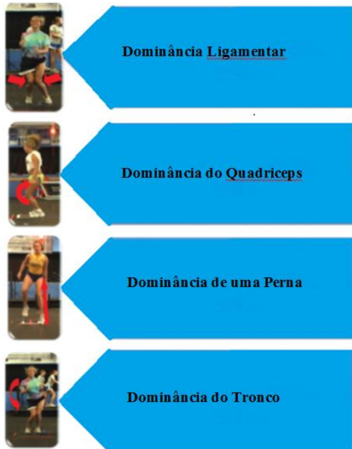
Imagem 1: Classificação dos défices neuromusculares segundo Hewett et al

correspondente desvio do centro de massa, o que acarreta maior risco de lesão do LCA (imagem 1) (10).