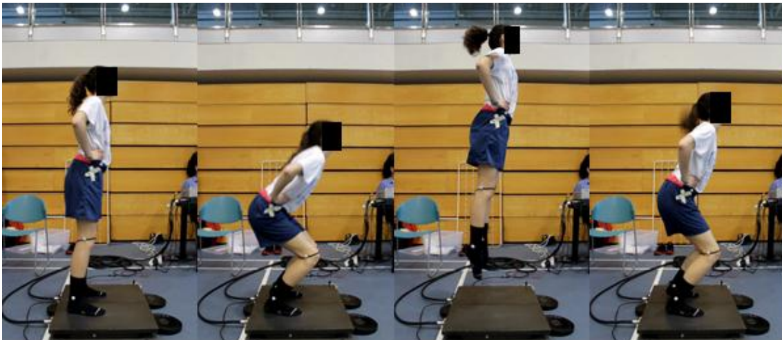
Imagem 2: Sequência do salto realizado.

O salto escolhido para a obtenção dos dados foi um salto vertical com contramovimento e sem balanço com os braços (SVCSBB) (imagem 2). Os atletas eram instruídos para colocarem os pés à largura dos ombros, olharem em frente e realizar o salto quando lhes fosse transmitida ordem para tal. O atleta procedia então à realização de um ligeiro agachamento (eram aconselhados a usar o grau de agachamento que achassem necessário), seguido de um salto até à altura máxima que conseguissem atingir.