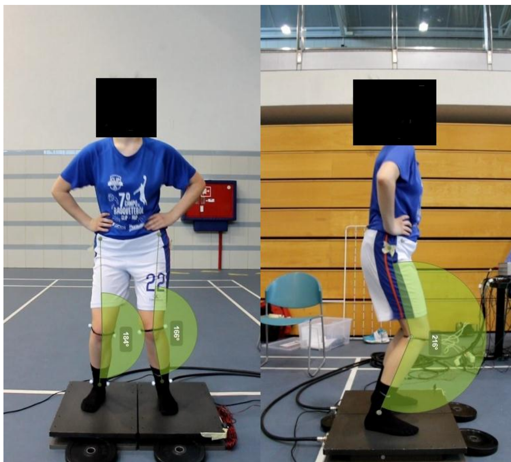
Imagem 6: Exemplo de atleta que aterrava em valgismo e pouca flexão do joelho.