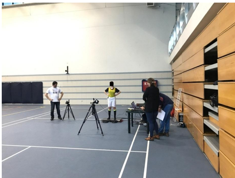
Imagem 3: Disposição do material no local da colheita dos dados.

Na outra secção os restantes investigadores faziam o registo dos vídeos. Cada atleta realizou três saltos verticais sendo encorajados a saltar o mais alto possível. Os participantes eram preparados previamente com a colocação de 5 marcadores em cada perna, um na espinha ilíaca superior, dois nas interlinhas medial e lateral do joelho e mais dois nos maléolos lateral e medial, sendo colocados sempre pelo mesmo investigador para evitar vieses no estudo. Os saltos eram registados por duas câmaras CANON EOS1100D®, uma no plano frontal e outra no plano sagital do lado direito, colocadas a 2,5m do atleta, a uma altura de 1,5m, e as imagens foram recolhidas a 30fps (imagem 3).