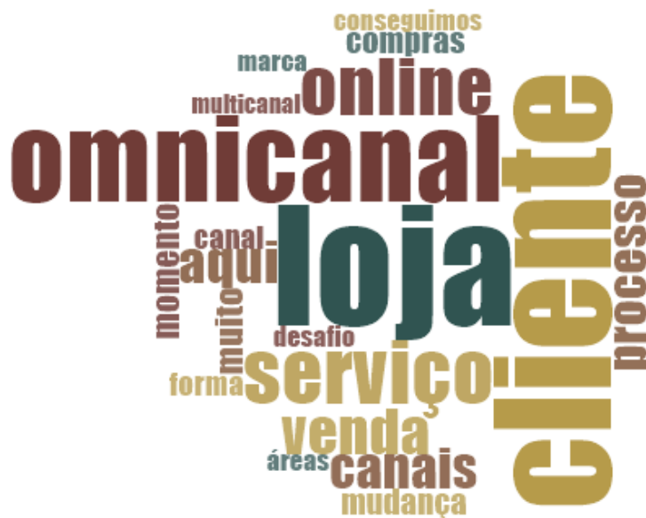
Figura 3: Nuvem de Palavras - As 20 palavras mais frequentes