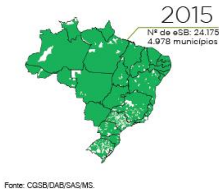
Figura 2 - Distribuição de municípios com ESB em 2015, adaptado de http://189.28.128.100/dab/docs/portaldab/publicacoes/cartilha_saude_bucal.pdf (sem permissão do autor).

As diretrizes da PNSB surgem com o propósito de oferecer a viabilização da fluoretação das águas de abastecimento público, a reorganização da atenção básica e da atenção odontológica especializada através da implantação de Centros de Especialidades Odontológicas (CEO) e dos Laboratórios Regionais de Próteses Dentárias (LRPD). (24)