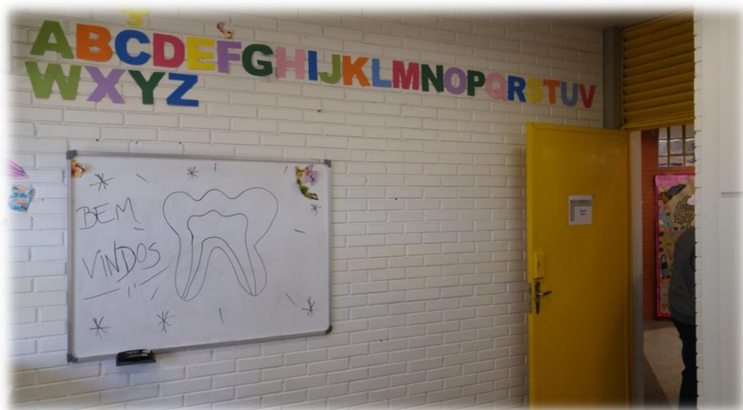
Figura 6 - Atividades coletivos na Escola Municipal de Ensino Fundamental Nossa Senhora de Fátima.

A definição do campo de prática das ESB na Atenção Básica estende-se muito para além do que é a cavidade oral, o que exige na composição das suas ações a integração de diferentes áreas de conhecimento.