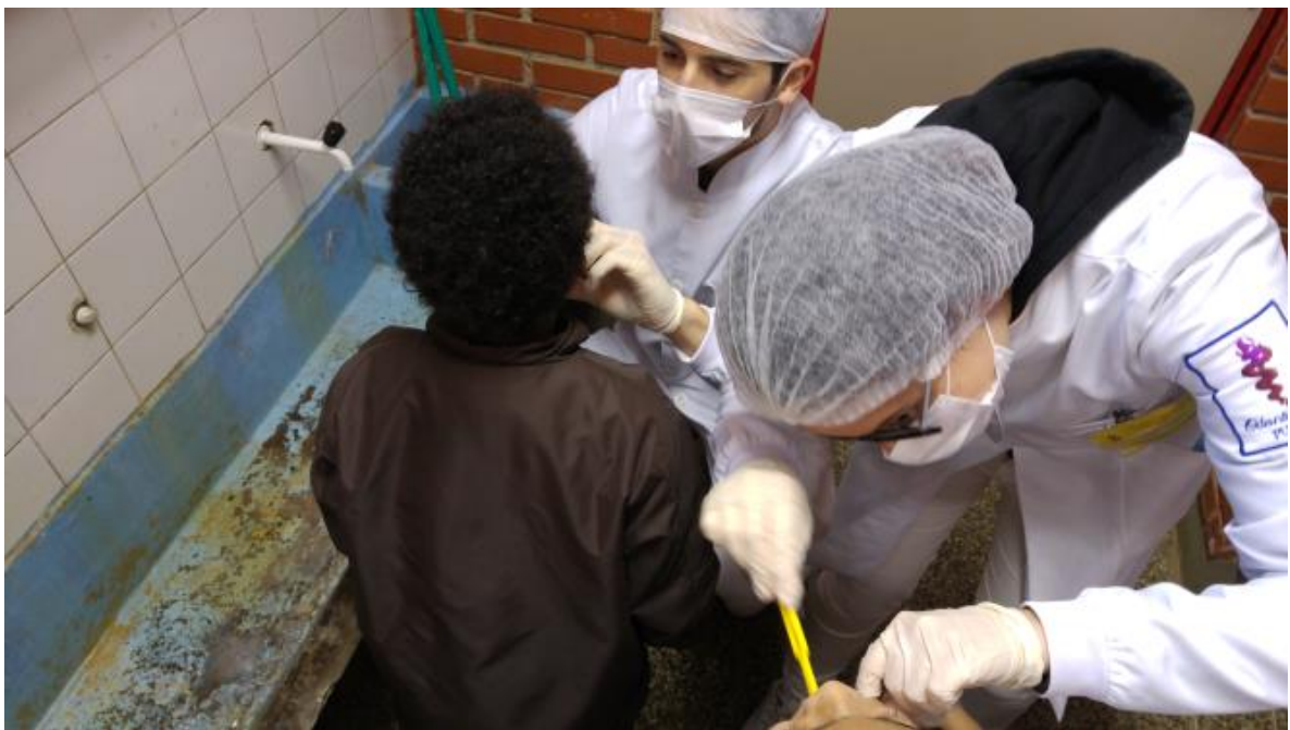
Figura 4 - Escovagem Supervisionada com Dentífrico Fluoretado e Instruções de Higiene Oral das crianças da Escola Municipal de Ensino Fundamental Victor Issler.

Para o alcance dos objetivos e sucesso do PSE é de fundamental importância compreender a Educação Integral como um conceito que compreende a proteção, a atenção e o pleno desenvolvimento da comunidade escolar. As eSF são por isso o veículo essencial para que estas ações se verifiquem nas escolas, principalmente na área da medicina dentária, onde é extremamente fácil analisar quais as necessidades dos jovens das comunidades. Estas equipas, providas de apenas alguns equipamentos fornecidos pelas Unidades de Saúde, conseguem realizar exames físicos e clínicos precisos, realizar escovagem supervisionada com dentífricos fluoretados, e conseqüentemente realizar instruções de higiene oral, promover saúde , alertar para algumas doenças que podem ser combatidas no dia a dia com uma correta educação, entre muitas outras ações que podem fazer a diferença nestas gerações do futuro. (30, 32, 33)