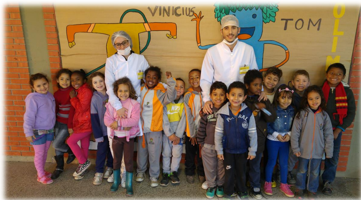
Figura 3 - Atividades desenvolvidas no âmbito do PSE na Escola Municipal de Ensino Fundamental Victor Issler.

O Programa Saúde na Escola (PSE), criado aquando da aprovação da PNAB, através de uma política intersetorial entre os Ministérios de Educação e da Saúde, é mais um dos contributos da estratégia de saúde da família e tem como objetivo contribuir para a formação integral dos estudantes por meio de ações de promoção, prevenção e atenção à saúde, com vistas ao enfrentamento das vulnerabilidades que comprometem o pleno desenvolvimento de crianças e jovens da rede pública de ensino. Estas ações são desenvolvidas na área de abrangência da ESF, por eSF, e a Escola é a área institucional privilegiada para este encontro da educação com a saúde, sendo um espaço que propicia a convivência social e o estabelecimento de relações favoráveis à promoção da saúde através de uma Educação Integral. (31)