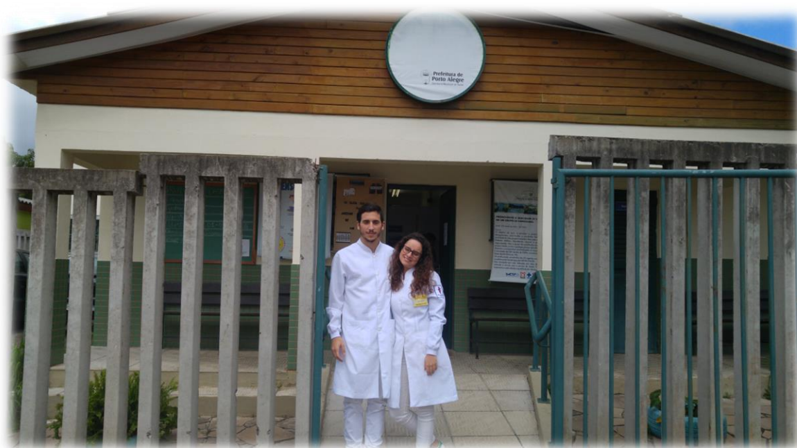
Figura 7 - Unidade de Saúde da Família Jardim da Fapa.

Como um professor pelo qual nutro muito carinho dizia, “O SUS não é um problema sem solução, mas uma solução com problemas”, e eu acredito que a vontade de mudar irá superar as dificuldades existentes para que o panorama da saúde oral no Brasil melhore cada vez mais, e o SUS é a sem dúvida a solução!