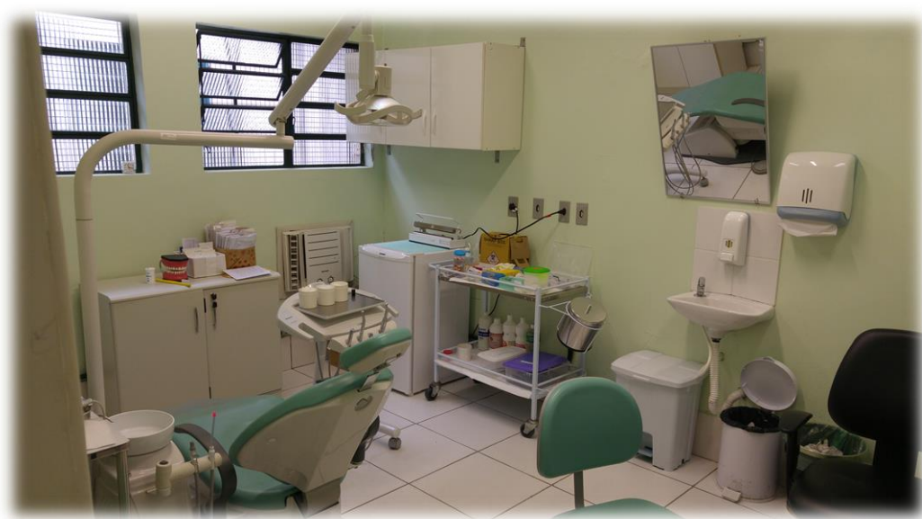
Figura 5 - Consultório Dentário da USF Jardim da Fapa.

Segundo a Política Nacional de Saúde Bucal, a organização das atividades da equipe de saúde bucal deverá ser orientada de forma a garantir que 75 a 85% das ações sejam voltadas ao atendimento clínico individual em consultório dentário, de modo a suprir a enorme demanda de utentes que necessitam de tratamentos dentários, enquanto 15 a 25% devem ser direcionadas a atividades coletivas, como atividades de promoção de saúde, visitas domiciliares, atividades em escolas, participação em conselhos locais, entre outras. (35)